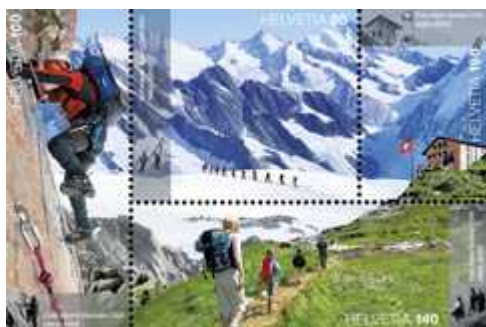
Марка «150-летию CAS»

Кроме того, вниманию филателистов предлагаются марки, посвященные 150-летию CAS, котор