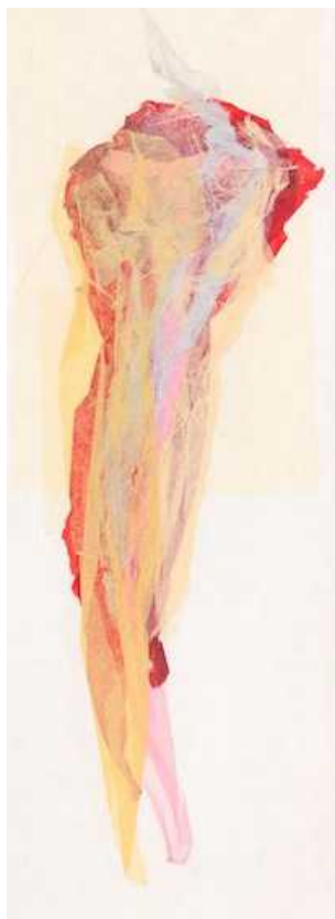
Без названия (© Inga Kiseleva)

некоторые работы. При подробном рассмотрении становится ясно: Киселев свободно владел сложной техникой. Но тщательность проработки деталей как бы отходит на второй план. Интенсивная динамика цвета и света захватывает. В этих работах, разных по эмоциональному наполнению, прослеживается одна общая черта: свободный жест художника утверждает вечный поиск. Для картин Киселева характерна внутренняя динамика вызова, переданная через абстрактные образы.