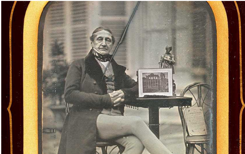
Жан-Габриель Эйнар (bilan.ch)

в 1914 году была преобразована в три акционерных компании, а сегодня является известным во всем мире промышленным гигантом.