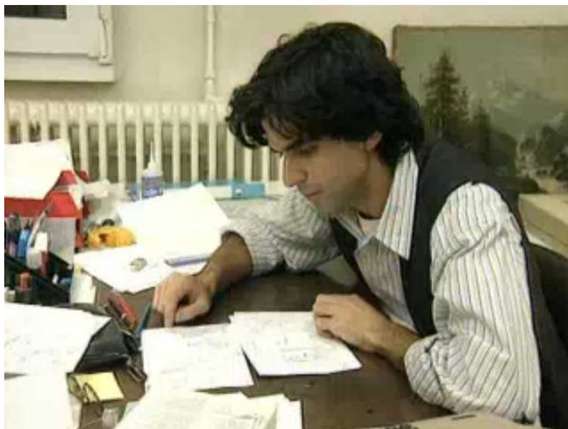
Патрик Шаппатт за работой