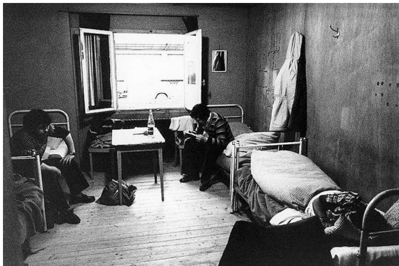
Комната сезонных рабочих (tdg.ch)

«Для нас очень быстро построили бараки. В каждой комнате жили четыре человека, у нас было очень мало душевых и туалетов».