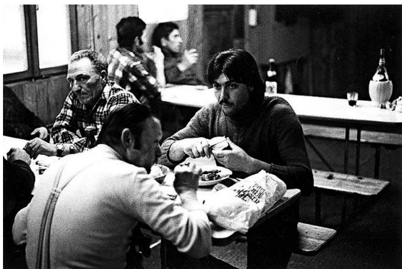
В столовой каждый готовил себе сам