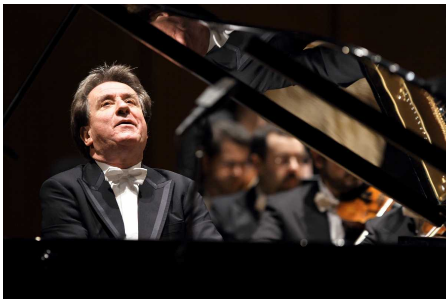
Пианист Рудольф Бухбиндер