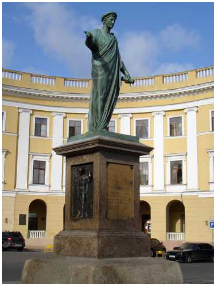
Памятник дюку де Ришелье в Одессе

В письмах Шарля-Рене содержится немало фактов, рассказывающих не только о событиях тех дней, но и о нравах общества, окружавшего молодого женева. Главным развлечением молодого человека была охота, которую время от времени устраивали его знакомые. Он также посещал своеобразные «мальчишники» жившего холостяком герцогом Ришелье и находил приятным и интересным узкий круг его друзей.