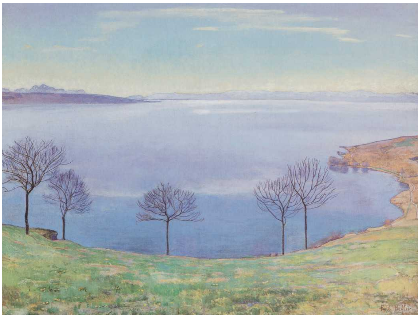
Фердинанд Ходлер. Вид на Женевское озеро. 1898 (Kunstmuseum Basel)