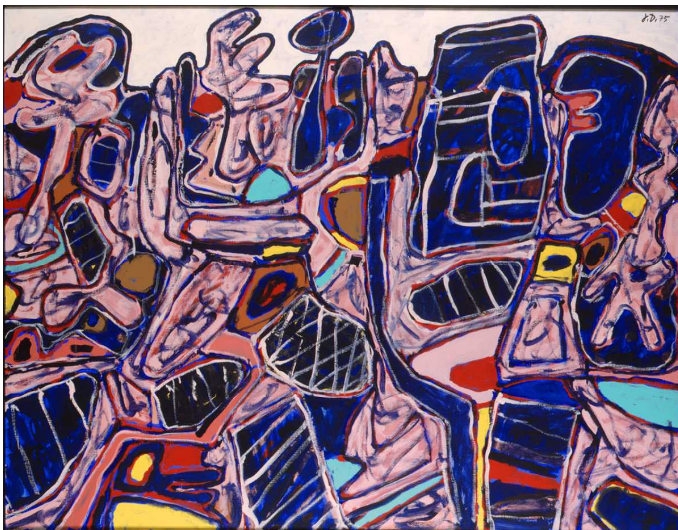
Жан Дюбюффе. Site aux itinéraires, 9 septembre 1975.

Начнет с картины «Лошади и коровы» Макса Эрнста, представленной галереей Richard Nagy. Эта редкая работа маслом, созданная приблизительно в 1919 году, в период расцвета дадаизма, отражает характерную для представителей этого движения расчлененную структуру. Эта же галерея представит «Renée Cordier» Рене Магритта (1936), произведение, относящееся к золотому периоду в творчестве художника, когда он играл с идеей картины в картине в театральных декорациях.