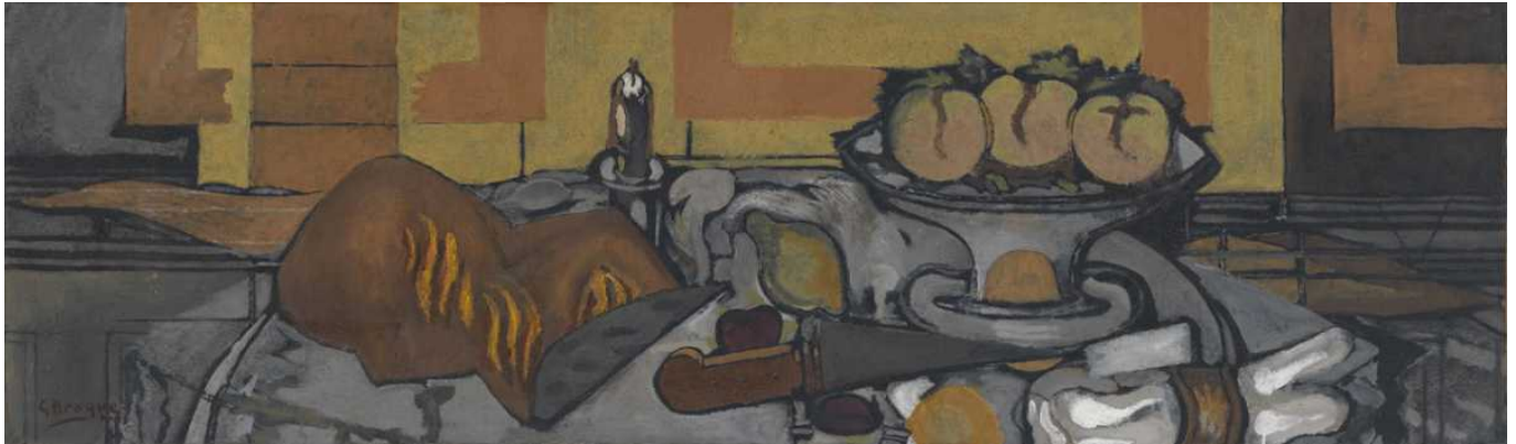
Жорж Брак. Compotier aux trois pommes, 1941

«Tête de Diego au col roulé» Альберто Джакометти (1951), представленная Dominique Lévy Gallery, - одна из первых бронзовых скульптур мужских голов и бюстов родственников и близких друзей, созданных в 1950-х годах и со временем ставших моделями для многих последующих работ.