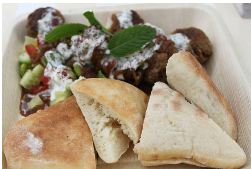
Не «фаст-фудные» блюда

При этом не следует путать уличную еду с фаст-фудом, определения того и другого дает Продовольственная и сельскохозяйственная организация ООН. Блюда и напитки из первой категории нередко отражают особенности местной кухни и отличаются большим разнообразием. Ларьки с такой едой часто находятся на улице и могут предложить клиентам простые стулья, если те желают съесть блюда на месте. Успех мини-предприятий построен исключительно на их удобном месторасположении и рекламе «из уст в уста». Чаще всего это – семейный бизнес, который, тем не менее, приносит пользу местной экономике, так как продавцы готовой пищи покупают продукты у знакомых фермеров.