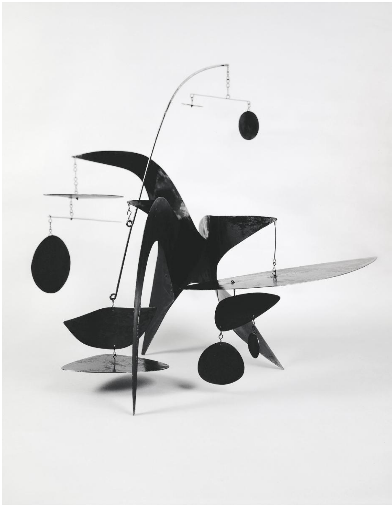
Александр Колдер. The General Sherman, 1945 (© 2016 Calder Foundation, New York/ProLitteris, Zurich))

... В самом начале выставки посетитель натывается на крысу и медведя, две фигуры в костюмах, панду и еще одну крысу, размером с ребенка. Они кажутся