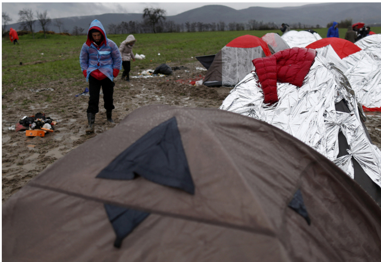
Лагерь беженцев в Идомени, Греция

Усиление контроля в сфере приема беженцев на фоне растущей террористической угрозы вполне ожидаемо. Напомним, что недавно в Швейцарии был вынесен первый приговор в связи с поддержкой ИГИЛ. Один из подсудимых, обвинявшихся в намерении создать на территории страны террористическую ячейку, попал в Швейцарию инвалидом в качестве беженца, использовав чужое имя, и, по данным местной прессы, консультировал своих сообщников о том, как избежать чрезмерного внимания властей в процессе получения статуса беженца. Разумеется, установить личность человека, обратившегося за помощью, и проследить его жизненный путь, да еще на этапе выдачи гуманитарной визы в представительстве Швейцарии за рубежом, не так просто. Увы, в результате ужесточения правил без защиты могут остаться и те, кто действительно в ней нуждаются: сообщается, что недавно SEM на несколько недель полностью приостановил выдачу гуманитарных виз выходцам из Сирии.