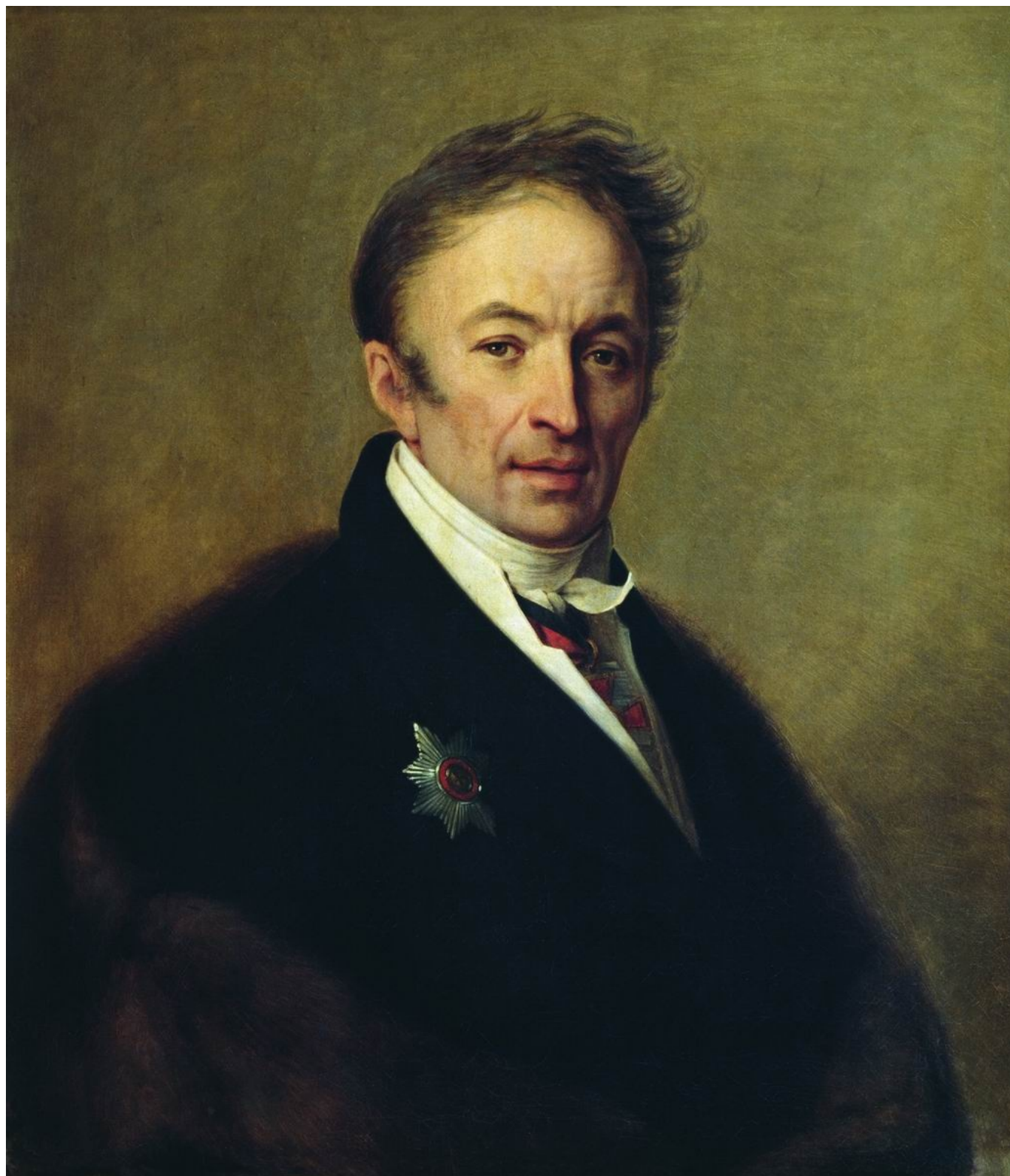
А. Г. Венецианов. Портрет Н.М. Карамзина. 1828

В 1789 году молодой русский автор Николай Карамзин, родившийся 1 декабря 1766 года в селе Знаменское Симбирской губернии (теперь Карамзинка Ульяновской области, при этом есть мнение, что он родился в Оренбургской губернии), отправился в путешествие по Европе и в 1790-м вернулся в Россию. Написанные им по возвращении «Письма русского путешественника» стали уникальным явлением во всей русской культуре. В «Письмах...» путешествие предстало не только как способ