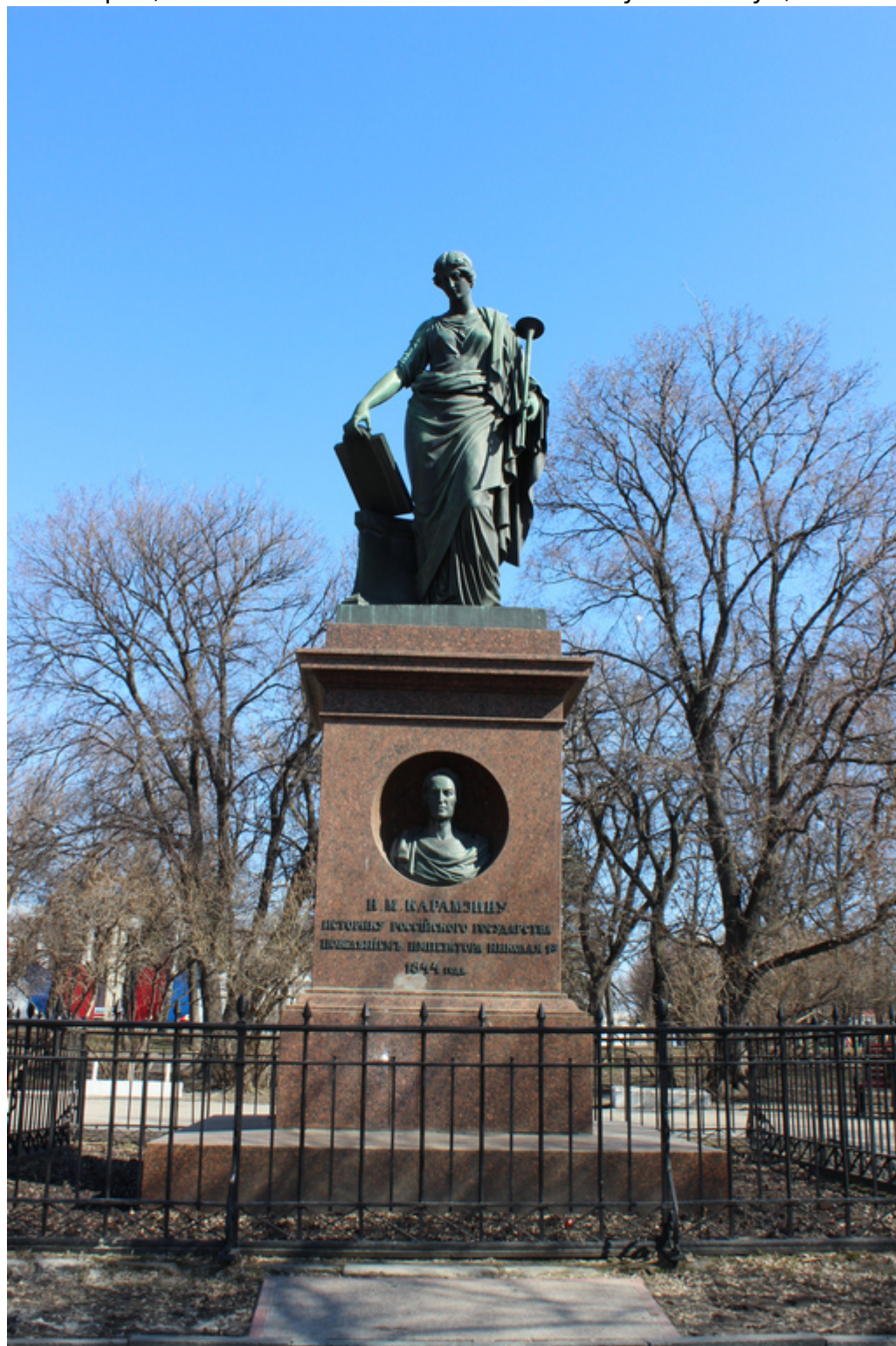
Памятник Н. М. Карамзину в Ульяновске

Одним словом, друзья мои, путешествие питательно для духа и сердца нашего. Путешествуй, ипохондрик, чтобы исцелиться от своей ипохондрии! Путешествуй, мизантроп, чтобы полюбить человечество! Путешествуй, кто только может!».