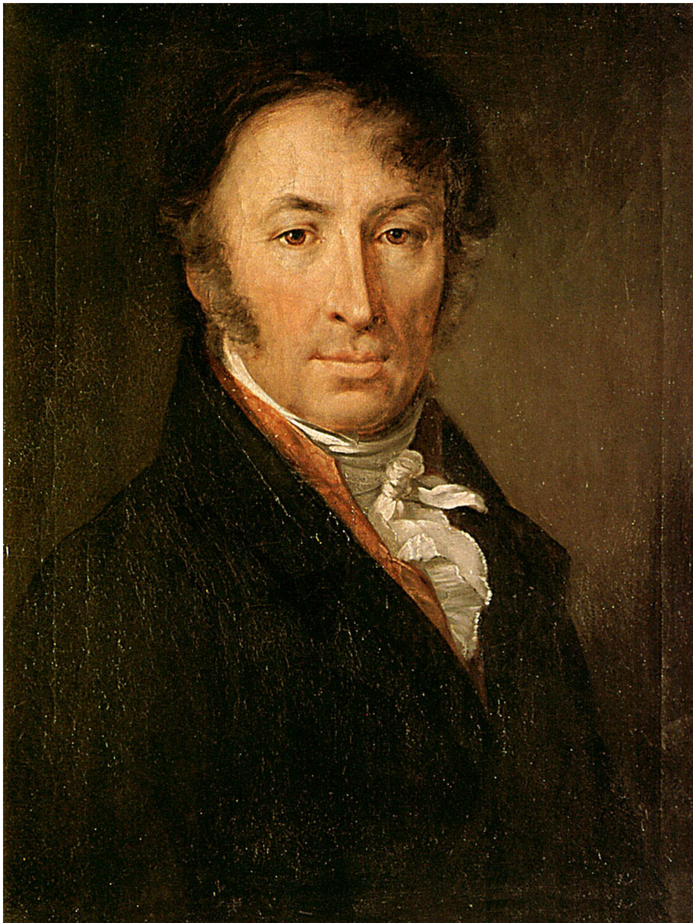
В.А. Тропинин. Портрет Н. М. Карамзина. 1818 г.