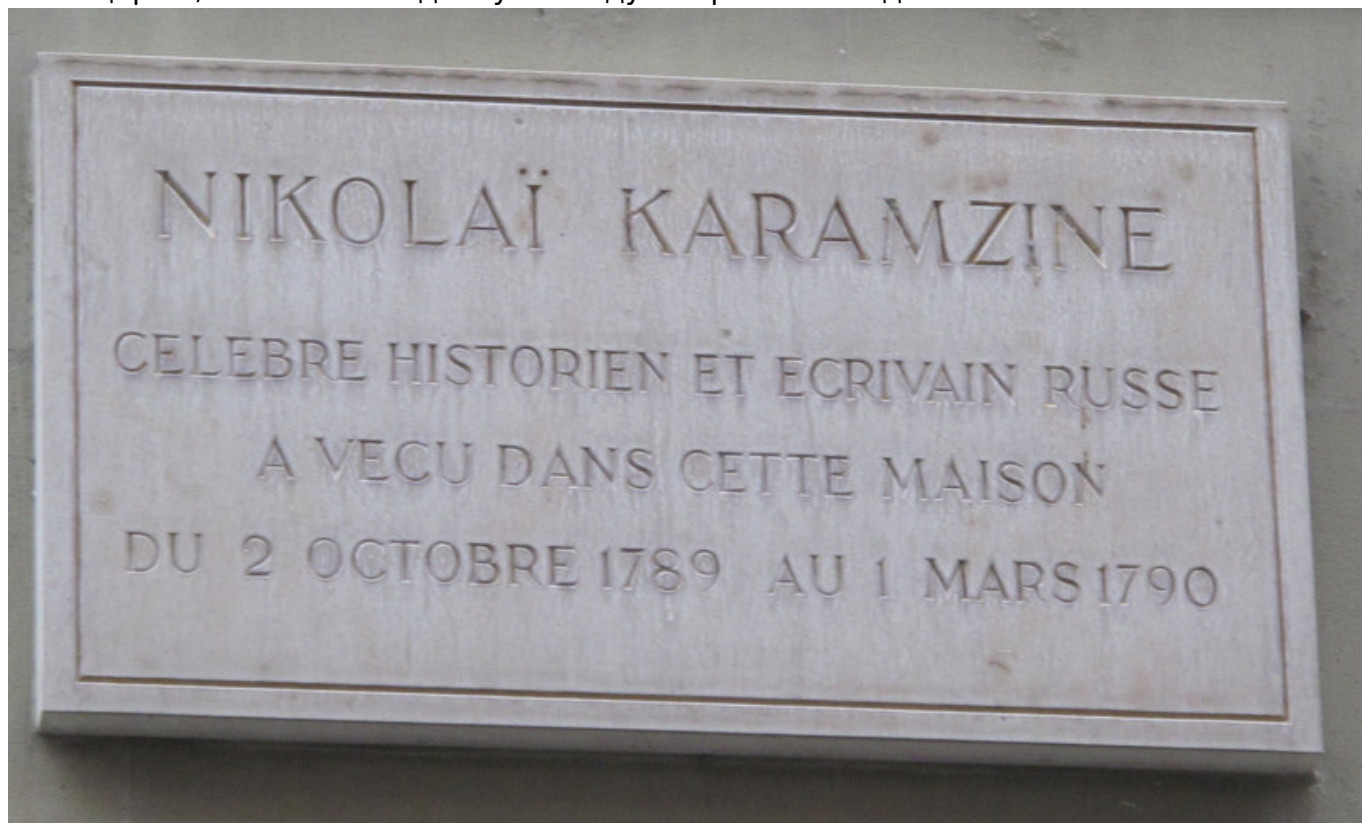
Мумориальная доска в память о Н.М. Карамзине на доме № 14 на Grand-Rue Женевы

О Французской революции он услышал впервые во Франкфурте-на-Майне; известие это его чрезвычайно взволновало. Въехав в Эльзас, он увидел там сплошное смятение: «целые деревни вооружаются, и поселяне пришивают кокарды к шляпам. Почтмейстеры, постиллионы, бабы говорят о революции». В Страсбурге взбунтовался здешний гарнизон: «солдаты не слушаются офицеров, пьют в трактирах даром, бегают с шумом по улицам, ругают своих начальников и проч.». Решительно не принимая анархии и революционного насилия, путешественник спешит в Швейцарию, «чтобы там вдохнуть воздух мирной свободы».