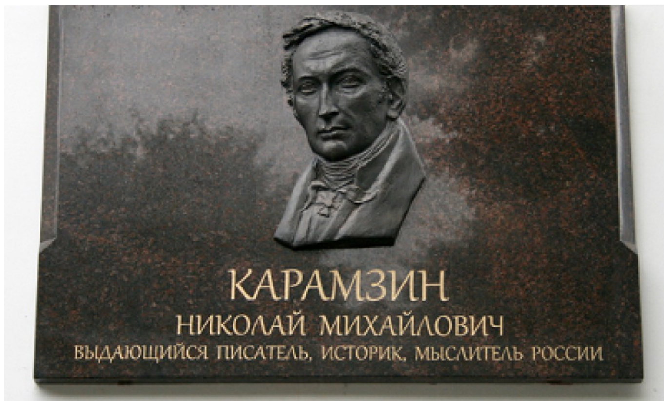
Н.М. Карамзин (1766-1826)