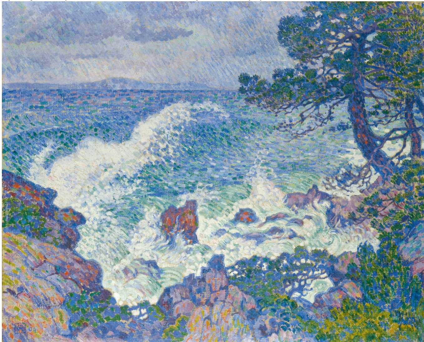
Тео ван Рейссельберге. Восточный ветер, 1904. Масло, холст, 81 x 100 см. Частная коллекция

Эрдмуте, вид на Хемниц из виллы, мадам Эш и еще один портрет Эрдмуте и Ганса-Герберта с няней, который неудовлетворенный автор порвал надвое. В воскресенье 29 октября Мунк, супруги Эш и шведский коллекционер Эрнест Тиль были приглашены на ужин к ван де Велде в Веймар, где через несколько дней Мунк приступил к работе над заказанным ему Тилем портретом Ницше.