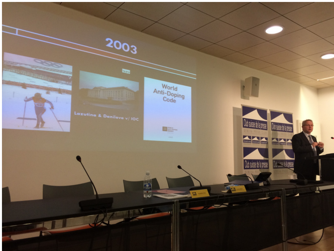
История CAS

ФИФА стала последней международной федерацией, признавшей юрисдикцию Спортивного арбитражного суда в Лозанне. Это произошло в 2002 году, и с тех пор CAS приходится разбирать по 100-250 «футбольных» дел ежегодно. По иронии судьбы последнее – и, пожалуй, самое громкое – касается бывшего президента ФИФА Зеппа Блаттера, отстраненного на 6 лет от профессиональной деятельности в связи с разразившимся в прошлом году коррупционным скандалом . В начале декабря CAS подтвердил это решение и оставил в силе штраф в размере 50 тысяч франков, который предстоит заплатить Блаттеру. Бывший президент ФИФА согласился с вынесенным вердиктом и отказался от дальнейших судебных разбирательств.