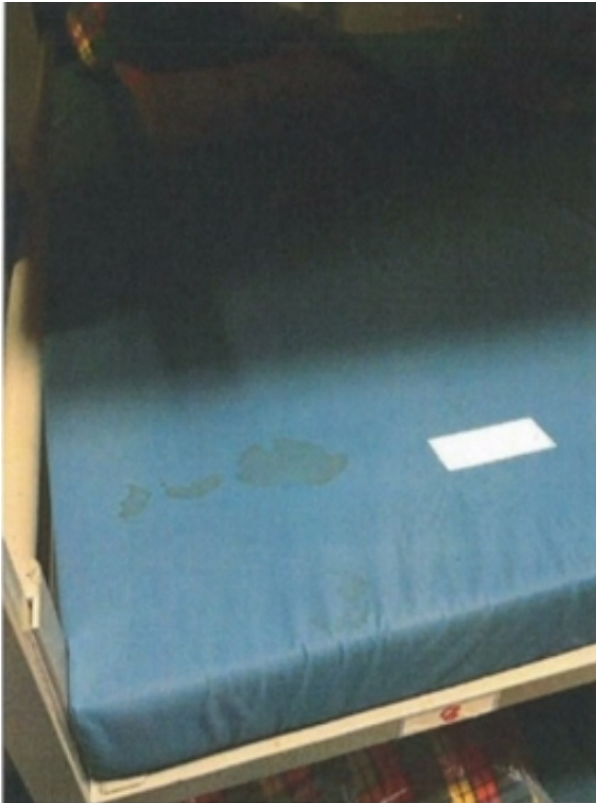
Один из матрасов в убежище гражданской обороны

Страдания полицейских закончились 13 января, когда их наконец-то перевели в более достойное помещение – казарму Верне, которая, должно быть, показалась им дворцом, с иронией отмечает RTS.