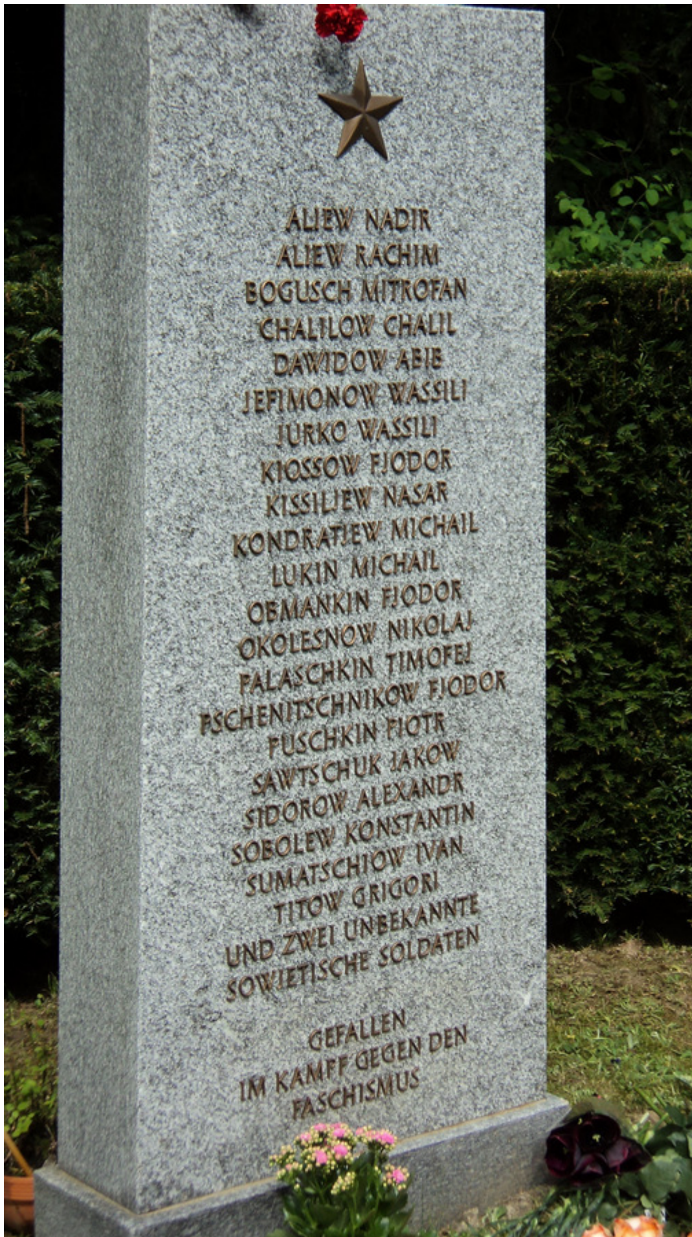
Памятник советским солдатам на кладбище Хернли в Базеле с фамилией Пшеничникова.

Дело о смерти было закрыто. Закрыта была и история интернированных. Те, кто