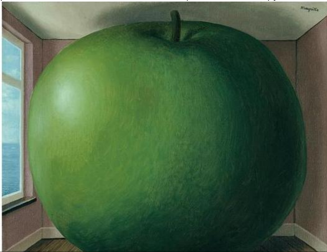
«Комната для прослушивания» (1958) – яблоко присутствует на многих полотнах Магритта

Другие средства также помогали художнику сделать из обычных вещей нечто странное. Например, изображение объектов, выполненных из непривычных материалов, произвольное комбинирование образов и слов, придание формы пришедшим из полусна видениям. Эти приемы видны на таких полотнах, как «Соблазнитель» (1953), где по морю плывет парусник, сделанный из... моря, «Весна» (1965), где мы видим птицу, созданную из деревьев. Рене Магритту была скучна реальность, он бежал от нее с мольбертом и кистью в руках.