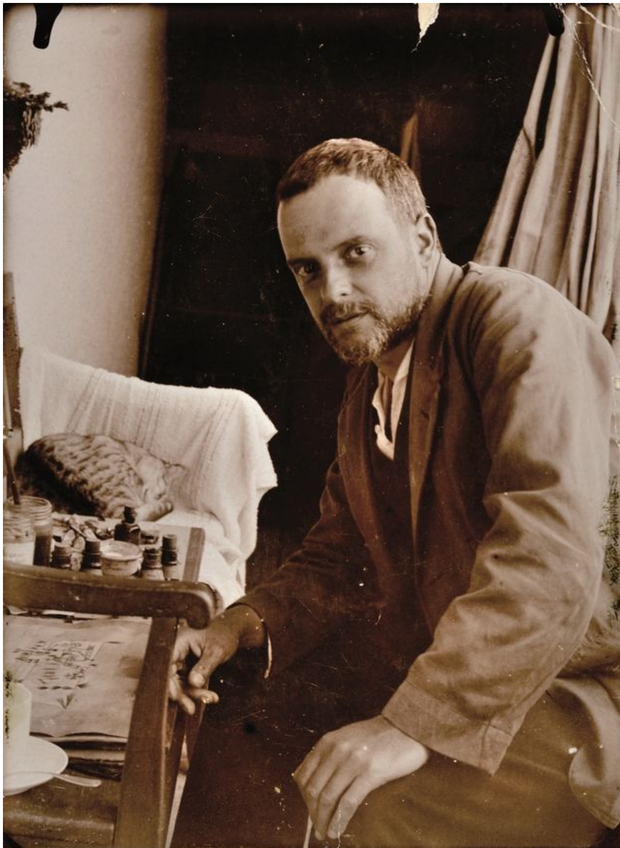
Пауль Клее и его кот Фрипуй.

Глупо? Несерьезно? Не спешите обвинять Клее в легкомысленности, лучше обратите внимание на дату. 1933 год. К власти в Германии пришли нацисты, и Клее уволен с поста преподавателя Академии искусств в Дюссельдорфе. Он пока не знает, что совсем скоро его картины будут объявлены «дегенеративным искусством», т.е. не отвечающим эстетическим представлениям Третьего Рейха, но он уже что-то