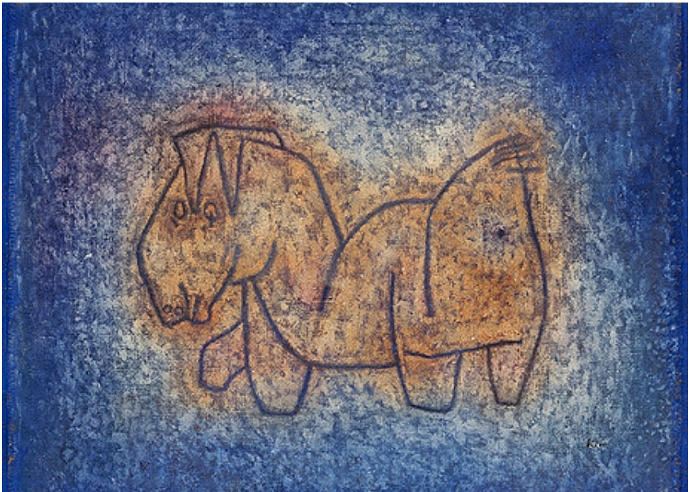
Paul Klee, Bastard, 1939

Author: Заррина Салимова, Берн , 26.10.2018.