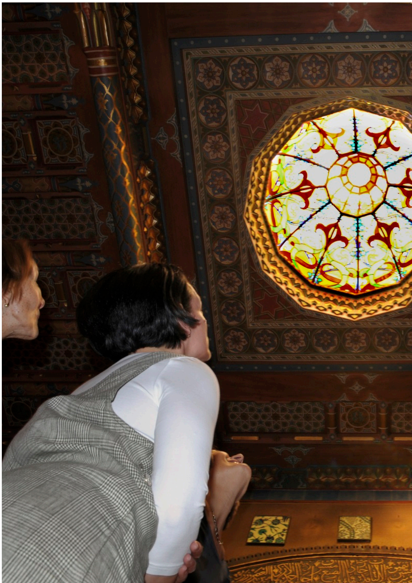
Персидская гостиная в Бернском историческом музее