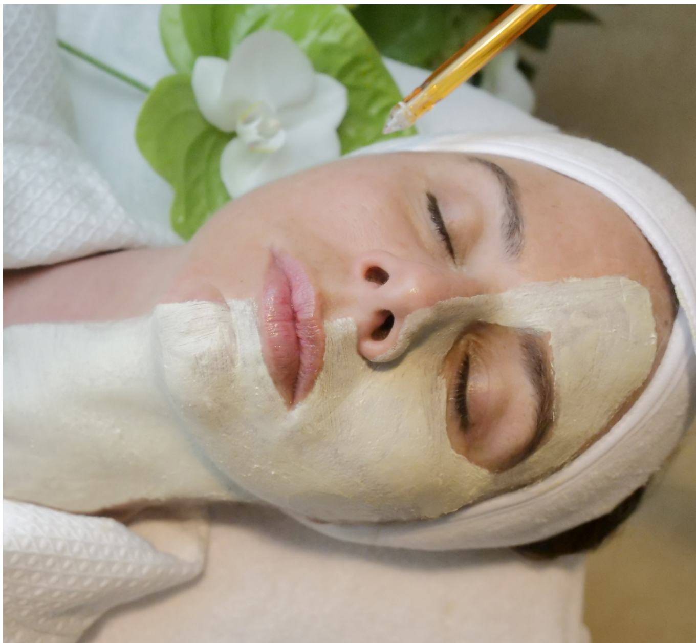
Маска из зеленой икры с бриллиантовой пудрой - must

К Каннскому фестивалю женевский Институт красоты L.RAPHAEL подготовил драгоценный подарок для всех красавиц – на этот раз в сотрудничестве с ювелирным брендом Chopard.