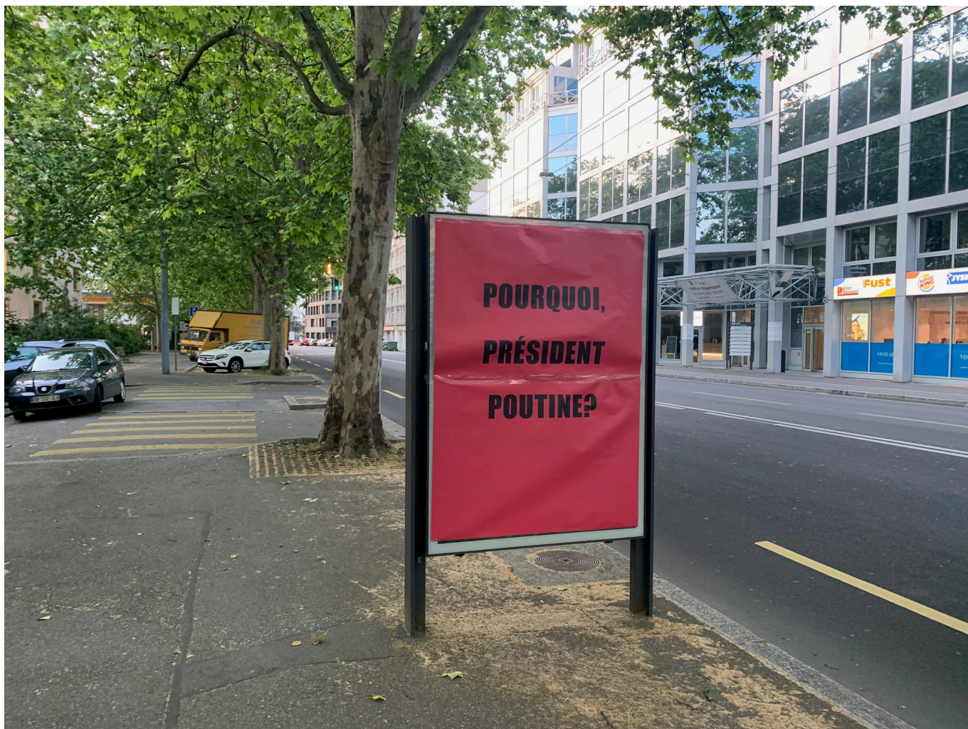
Президент Путин этим путем не поехал

... В полдень на огромном экране пресс-центра продолжали сменять друг друга беззвучные кадры: безлюдный парк Ла Гранж, безучастный фонтан, украшенный российскими и американскими флагами и совершенно пустой мост Монблан (движение по нему было остановлено), зеваки перед заграждением у отеля Four Seasons, суета в аэропорту в ожидании «с минуты на минуту» приземления российского борта № 1 – наш Илюшин, по мнению швейцарского комментатора, ни в чем не уступает самолету «Potus», то есть президента Байдена.