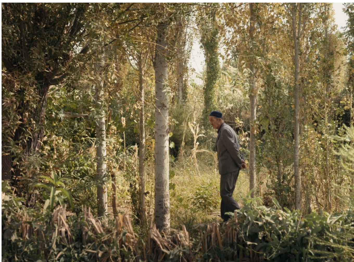
Кадр из фильма «Аралкум».

Для участия в конкурсной программе были отобраны 124 фильма из 3 000 заявок. Внимательно изучив список участников, мы обнаружили несколько лент, которые могут заинтересовать наших читателей. Так, 10 и 12 апреля можно будет увидеть фильм Даниэля Асади Фаези и Милы Жлуктенко «Аралкум» о высыхании Аральского моря, расположенного на территории Казахстана и Узбекистана. Первоначальная площадь моря была в два раза больше Бельгии, но интенсивное выращивание хлопка, начатое в советское время, привело к опустыниванию.