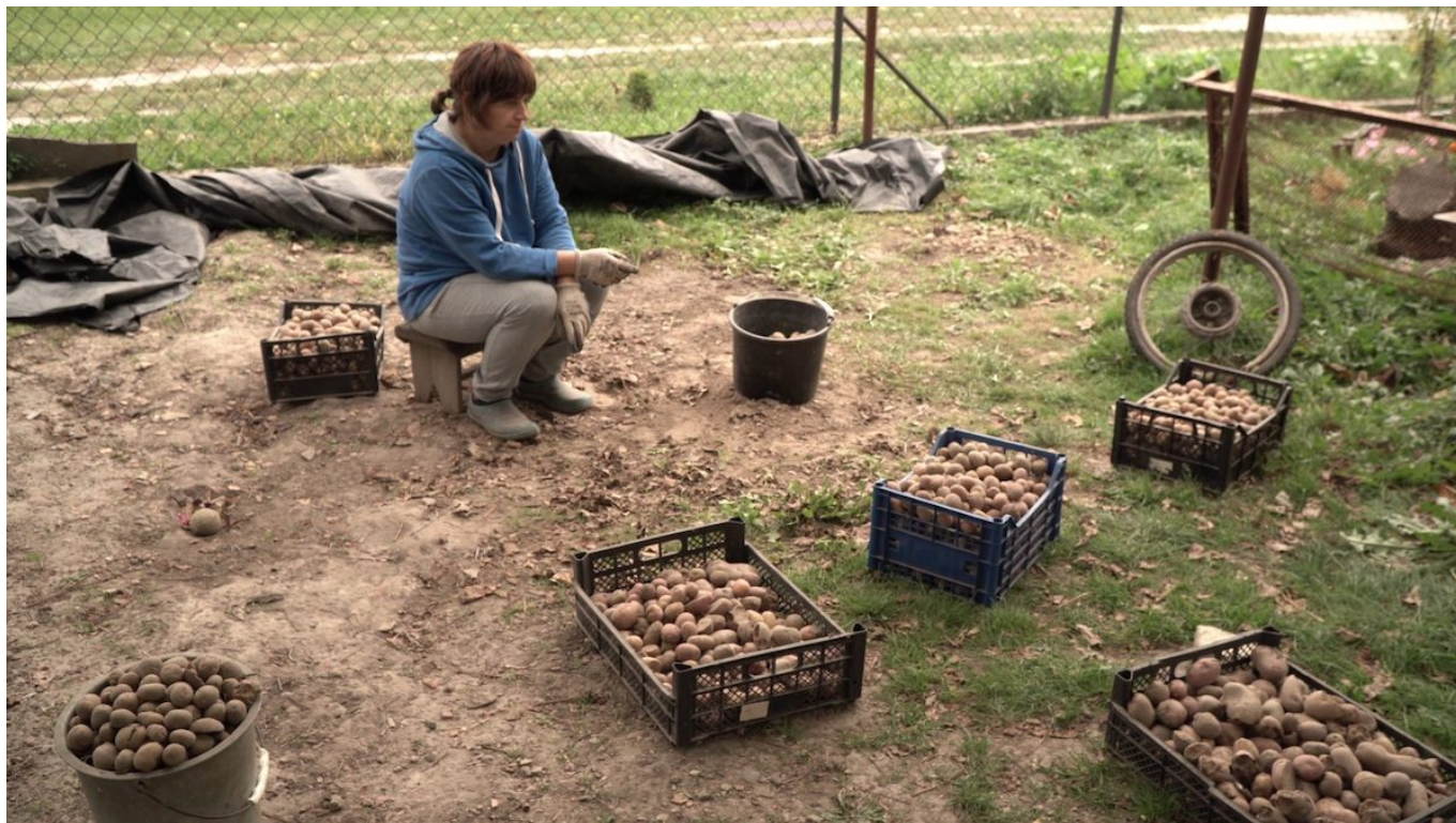
Кадр из фильма «Земля крутится».

В 20-минутном фильме украинского режиссера Елены Кириченко «Земля крутится» показаны события весны 2020 года, когда жители Украины оказались в карантине. Вернувшись домой после трехлетнего перерыва, Елена сталкивается с депрессивной матерью и больным отцом, который топит горе в алкоголе. Исчезнувший мир детства и разочарование реальностью взрослой жизни – режиссеру удалось уловить на камеру тонкие грани чувств. Показы состоятся 13 и 16 апреля.