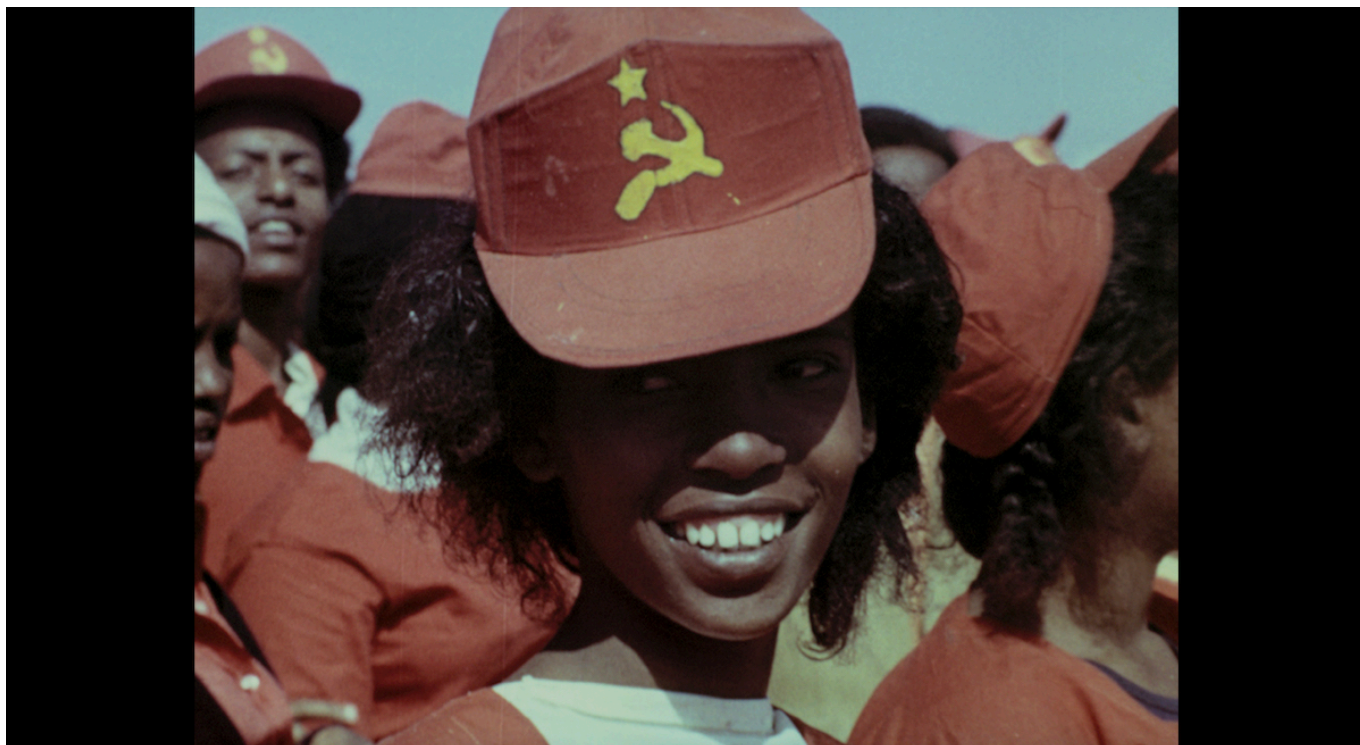
Кадр из фильма «Красная Африка».

«рая». Фильм будет показан 11 и 13 апреля.