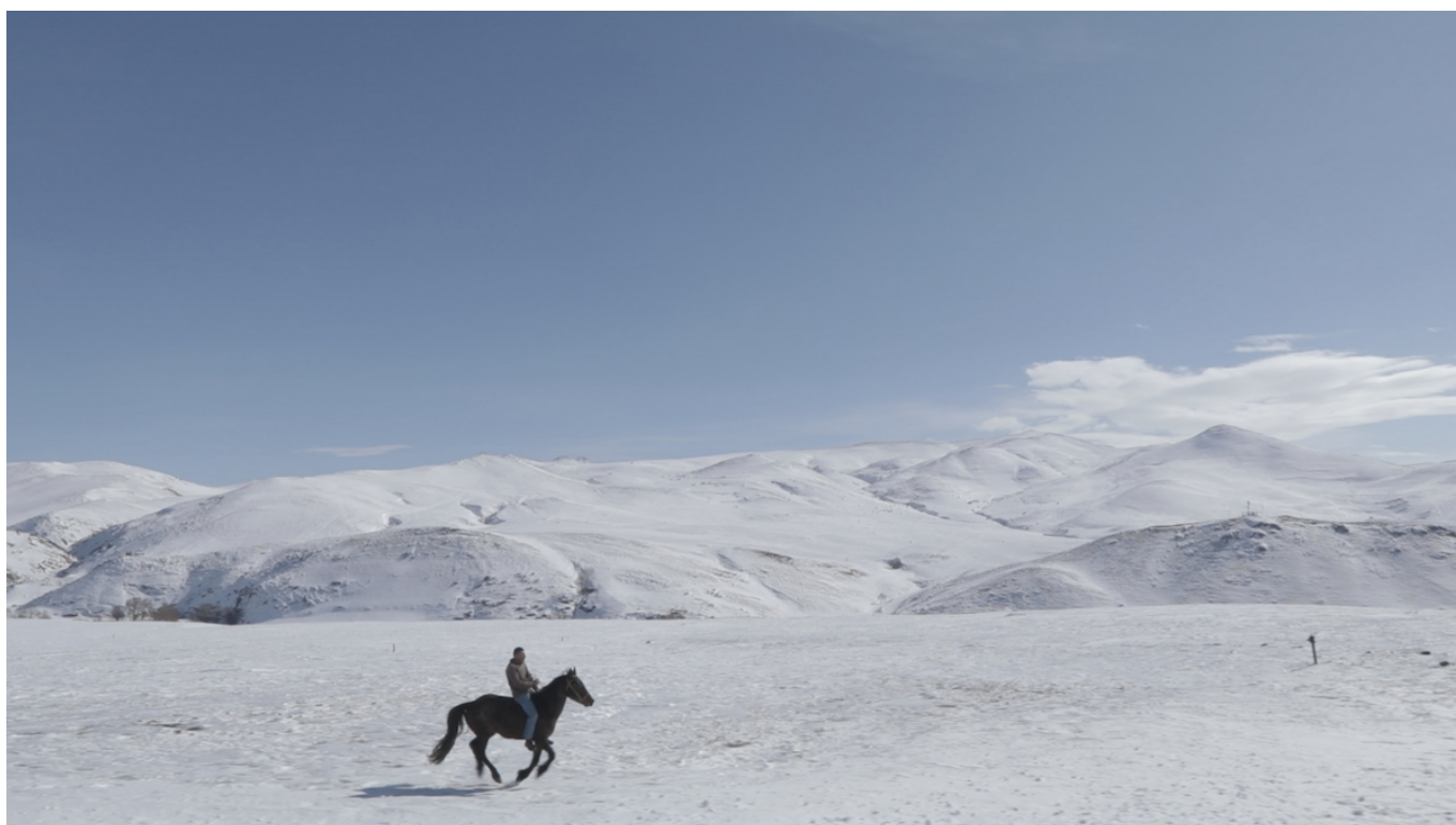
Кадр из фильма «5 мечтателей и лошадь».

Армянские режиссеры Арен Малакян и Ваагн Хачатрян участвуют в конкурсе с фильмом «5 мечтателей и лошадь» . Современная Армения представлена в ленте через истории и мечты главных героев: лифтерша в больнице, которая хочет полететь в космос; фермер в поисках идеальной жены, представляющий традиционный сельский уклад общества, в котором доминирует патриархат; молодые феминистки и квир-люди, которые просто хотят жить своей жизнью. Фильм заканчивается сценами начинающегося конфликта и тревожным и неоднозначным образом толпы, собравшейся на площади... Он будет демонстрироваться 13 и 15 апреля.