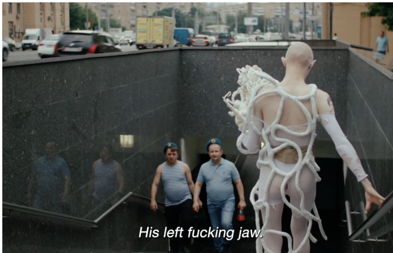
Кадр из фильма «Квиндом»