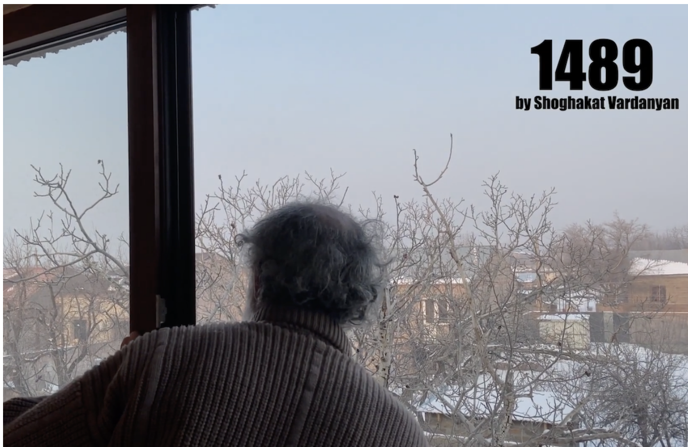
Кадр из фильма «1489»