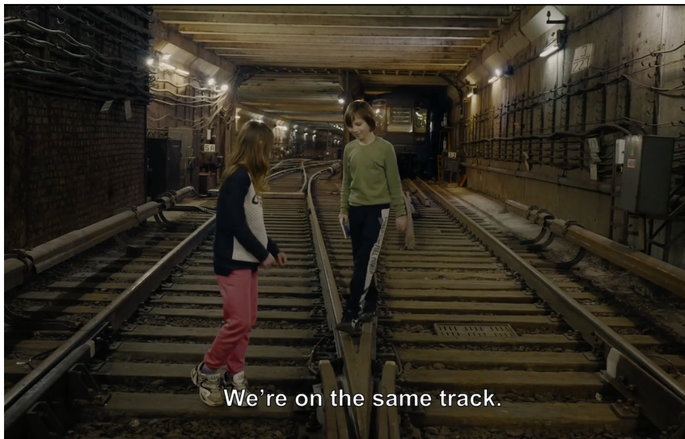
Кадр из фильма «Фотофобия»