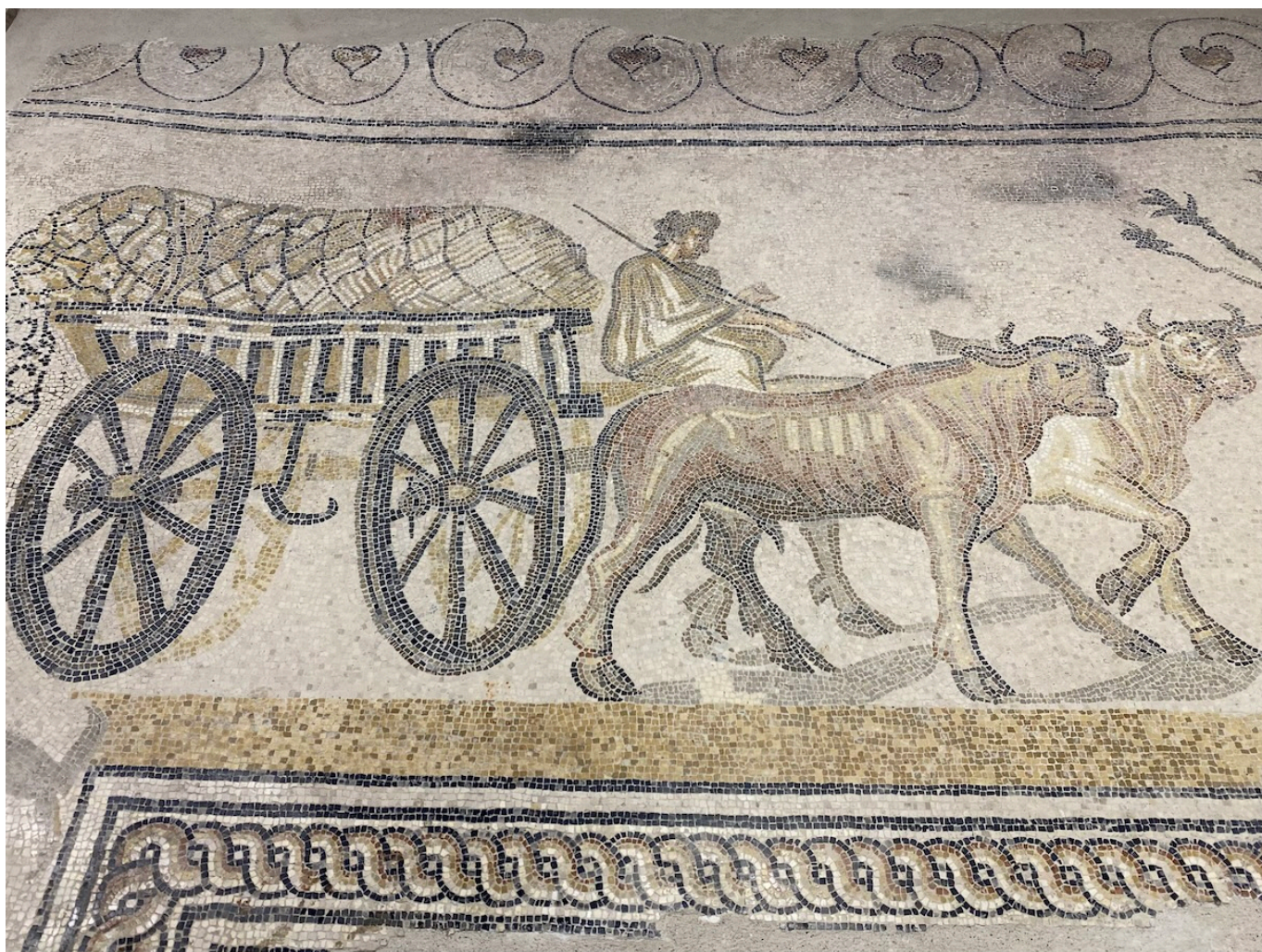
Мозаика «Деревенская процессия».

Author: Зарина Салимова, Орб , 31.05.2024.