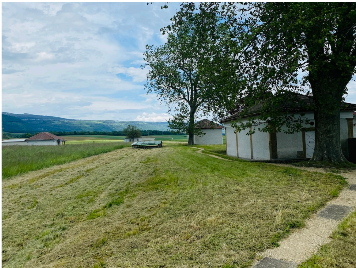
Павильоны с мозаикой на месте бывшей villa rustica.

Техника римской мозаики заключается в искусном сочетании цветов и размеров камней, которым придавали нужную форму с помощью специального молотка и клина. В качестве элементов мозаики использовались цветные камни, мрамор, керамика и стекло. Сначала делался эскиз, затем камни укладывались на основу из римского бетона, состоящего из извести, воды и песка, чтобы окончательно доработать рисунок. Иногда к настенной мозаике добавляли другие элементы, например, лепнину или ракушки.