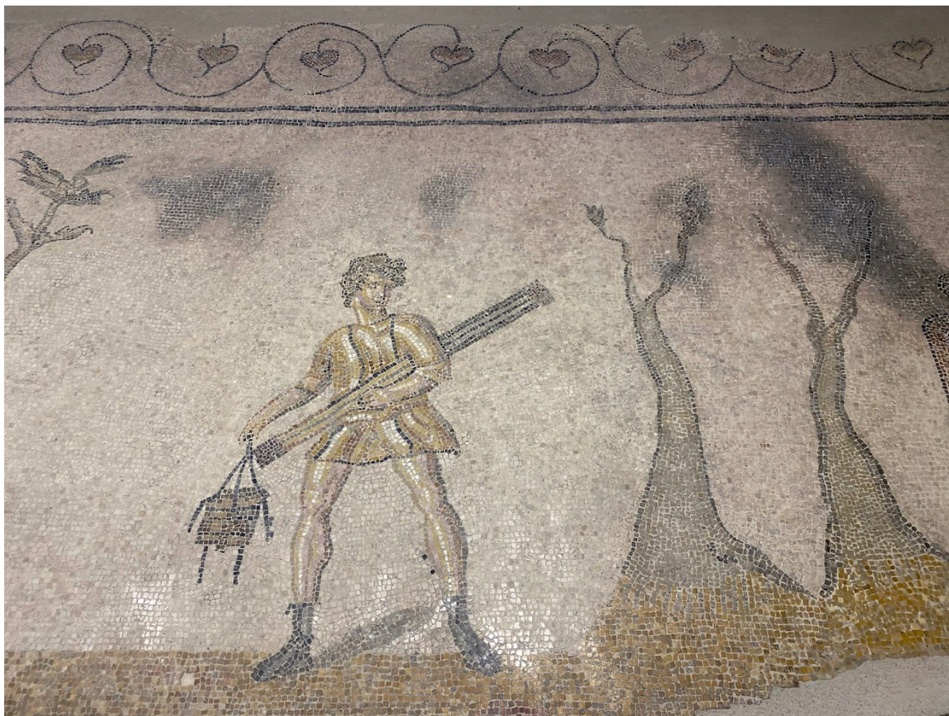
Часть мозаики «Деревенская процессия».

Одной же из самых красивых и лучше всего сохранившихся на территории комплекса считается мозаика, украшавшая комнату отдыха в термальном крыле. В шестиугольных медальонах представлены боги, в честь которых в римской культуре были названы дни недели: Луна (понедельник), Марс (вторник), Меркурий (среда), Юпитер (четверг), Венера (пятница), Сатурн (суббота), Сол (воскресенье). Изображены также различные мифологические фигуры, такие как Тритоны и Нереиды, Ганимед, Нарцисс. По углам расположены бюсты, обозначающие времена года, а по краю – сцены охоты с различными животными (собаками, лошадьми, кабанами, львами).