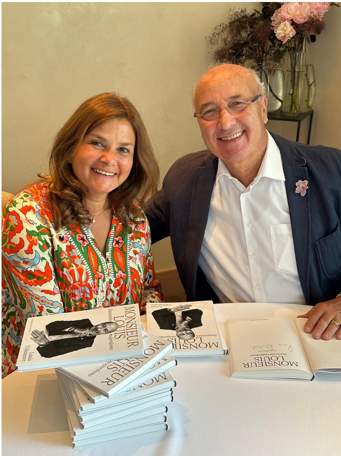
Un moment de gloire "par alliance" pour l'autrice de ses lignes

Source URL: https://dev.nashgazeta.ch/blogpost/louis-villeneuve-maitre-enchanteur