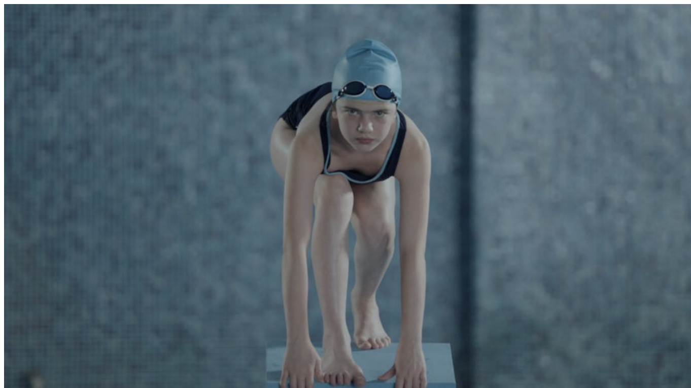
Кадр из фильма «Inhale».

Высшей школе искусства и дизайна (HEAD) в Женеве. Главная героиня ленты, тринадцатилетняя Нино, незадолго до важных соревнований по плаванию обнаруживает, что у нее впервые началась менструация. Тренер не разрешает ей участвовать в соревнованиях, утверждая, что ее женское телосложение не подходит для спорта. Нино чувствует себя преданной как своим тренером, так и своим телом. Фильм можно будет посмотреть 25 и 27 января.