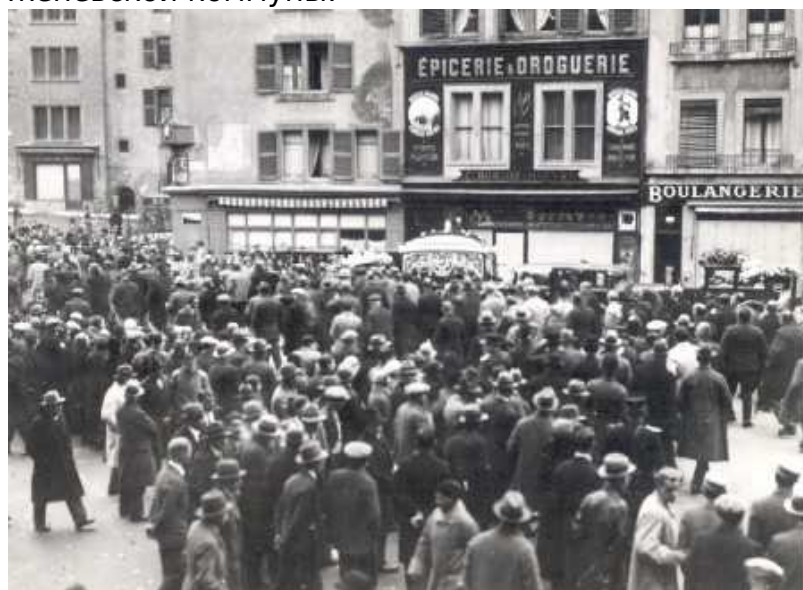
Начало митинга Национального Союза

деревьями, а в 1662 году, после демонтажа городских фортификаций, она приняла уже современные, знакомые нам очертания. В 1848 году Пленпале приобрел статус женевской коммуны.