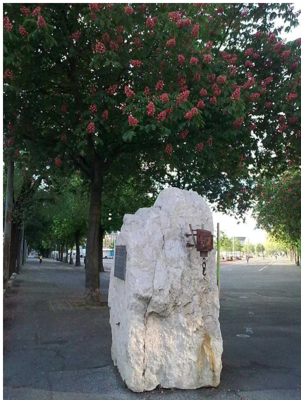
Памятник жертвам расстрела мирной демонстрации в Женеве 9 ноября 1932 года