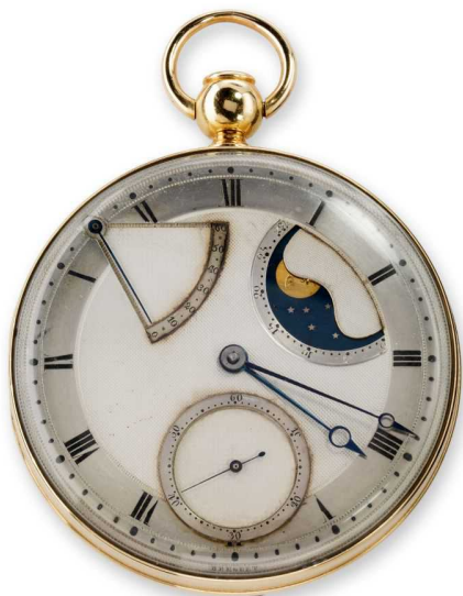
"Вечные часы" от Breguet, ок. 1794

В 1793 году Бреге покидает революционную Францию, получив угрозы за свои связи с королевским двором, и на несколько лет возвращается на родину – в Швейцарию. Еще бы: коронованные особы не преминули оказать особое внимание талантливому мастеру: в 1771-1780 годах он работает над механизмом автоматического завода часов, которым он даст название «вечных» (никогда не останавливающихся). Бреге мечтает создать карманные часы, которые заводились бы специальным устройством от одних только движений в кармане владельца, без использования ключика. Первые модели «вечных» часов приобретут лично Людовик XVI и Мария-Антуанетта, герцог Орлеанский и некоторые другие особы, близкие ко двору.