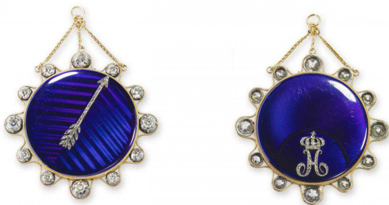
Маленькие тактильный часы-медальон Breguet, проданные Жозефине Бонапарт 18 февраля 1800 года

Пятнадцатилетний подмастерье из Невшателя прибывает во французскую столицу с адресами швейцарских часовщиков, обосновавшихся в Париже. Он общается со специалистом по морским часам Фердинандом Берту и знаменитым изготовителем механических часов и кукол-автоматов Жан-Пьером Дро, родом из Ля Шо-де-Фон. К слову, именно Дро создал для Бреге пантограф, воспроизводивший микроскопическую «секретную подпись» мастера на его произведениях для защиты от подделок. Молодой Бреге поддерживал отношения и с неким Жан-Полем Маратом, приехавшим из Будри близ Невшателя в Париж творить историю Французской революции.