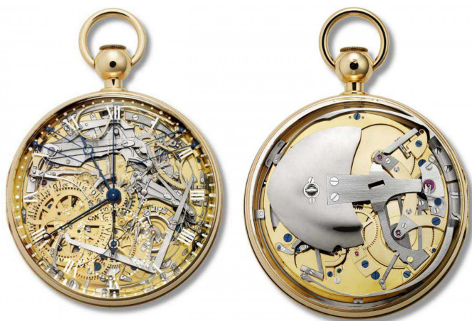
Breguet, "Часы Марии-Антуанетты"

Для Швейцарии, в каком-то смысле «вернувшей» себе Breguet через Swatch, болезненным остается лишь один вопрос: кому, Парижу или Невшателю, по праву принадлежит слава легенды часовых дел? Несомненно, Бреге провел в Париже большую часть жизни, 60 лет из 77, был женат на француженке и получил французское гражданство. Между тем, его связи с родной страной определили неповторимый стиль марки и ее технические достижения.