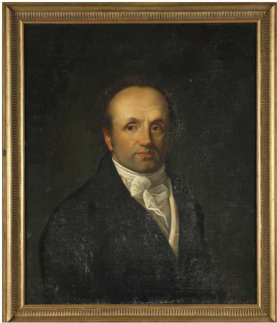
Портрет Абрахама-Луи Бреге, выполненный неизвестным художником, ок.1800

легендарной ауры, которая окружила название марки.