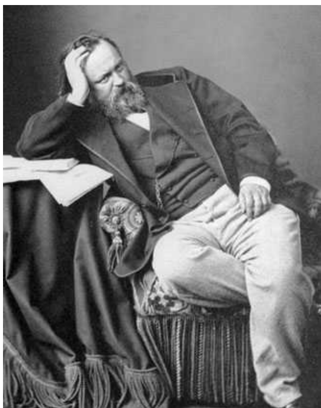
"Искандер" - Александр Иванович Герцен