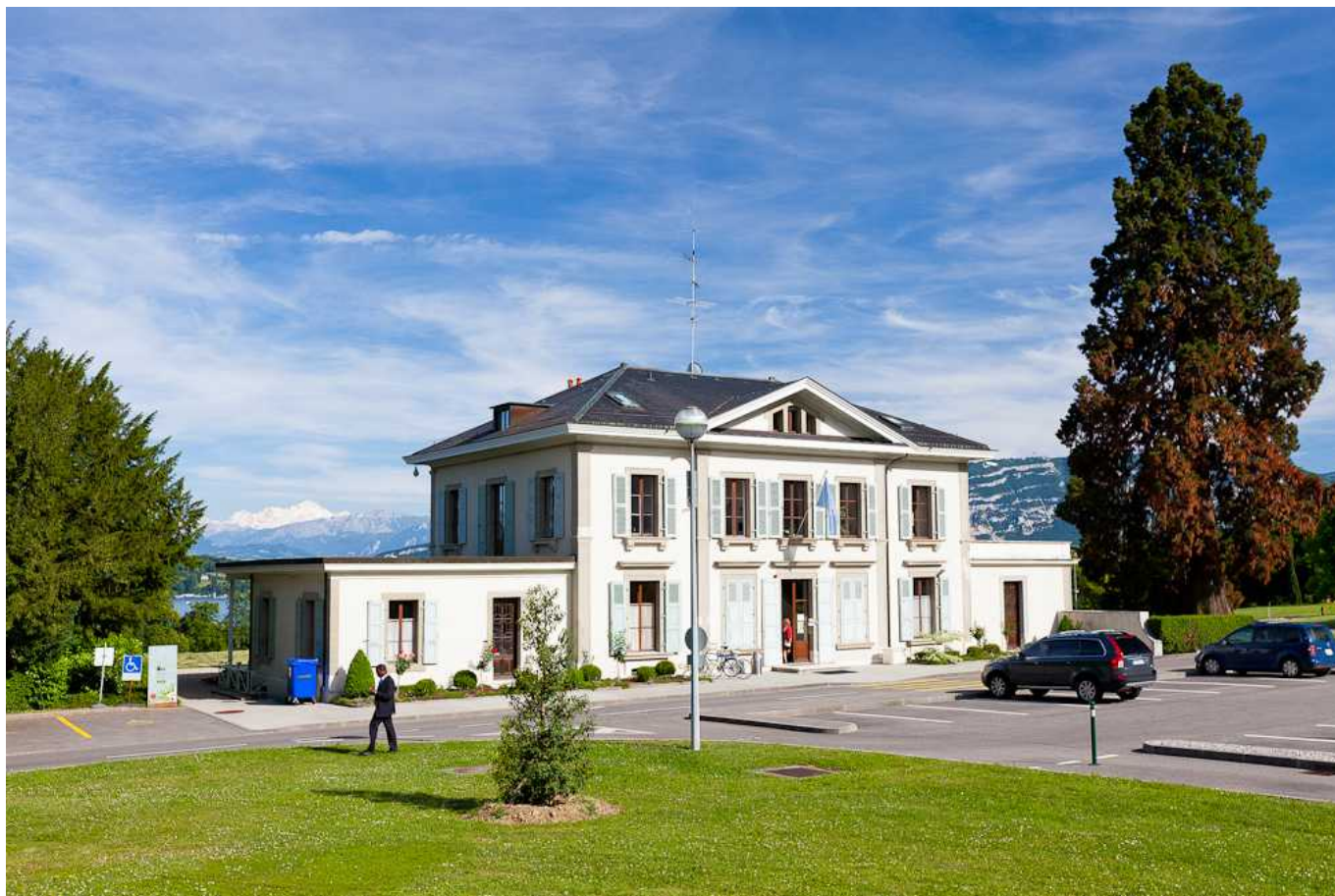
Вилла La Pelouse в Женевском парке Ариана

Auteur: Наталья Беглова , Женева , 30.06.2014.