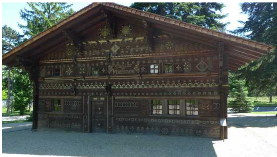
Шале Монбовон

Дюваль еще в 18 веке. Рядом с ней разбит миниатюрный парк во французском стиле. К нему ведет небольшая лестница, украшенная с двух сторон вазонами. Если посмотреть на парк, стоя наверху этой лестницы, то, как и положено, внизу вы увидите четкую графическую картину, созданную из выложенных гравием дорожек, небольших прямоугольных бассейнов и аккуратно подстриженных низких кустов самшита. Отличие от большинства традиционных парков такого рода состоит в том, что этот осеняется ветвями огромного, наверняка столетнего, ливанского кедра.