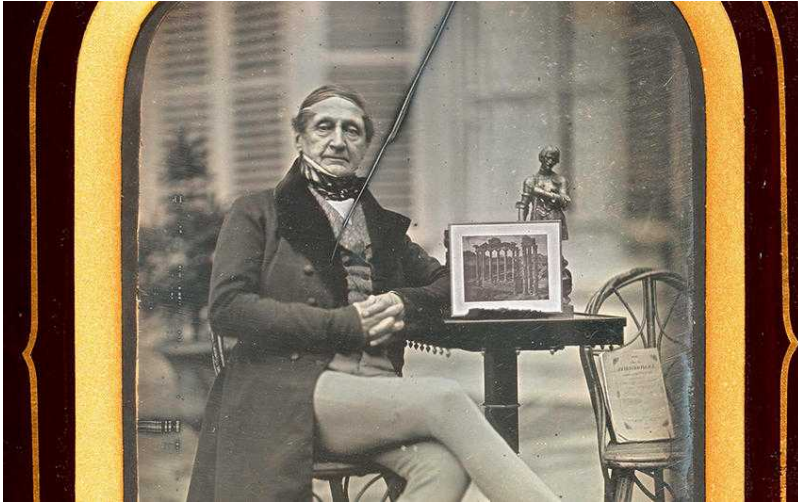
Жан-Габриель Эйнар (bilan.ch)

в 1914 году была преобразована в три акционерных компании, а сегодня является известным во всем мире промышленным гигантом.