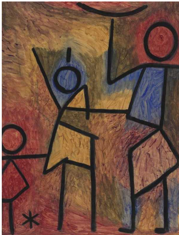
Пауль Клее. Без названия. 1940 год

Вся экспозиция построена в привычной академичной манере: полотна сгруппированы по хронологическому и тематическому принципам, что позволяет последовательно проследить эволюцию стиля художника. Вполне закономерно, что первый зал посвящен ранним работам Клее, созданным под влиянием художников, к тому моменту уже сформировавших свой собственный подход к живописи. Не нужно быть искусствоведом, чтобы уловить влияние Кандинского, Марка и Маке. Познакомившись с ними на первых выставках творческого объединения «Синий всадник», Клее перенимает их идеи и даже проявляет еще больший радикализм, провозглашая принцип о том, что «подлинное искусство наивно и примитивно».