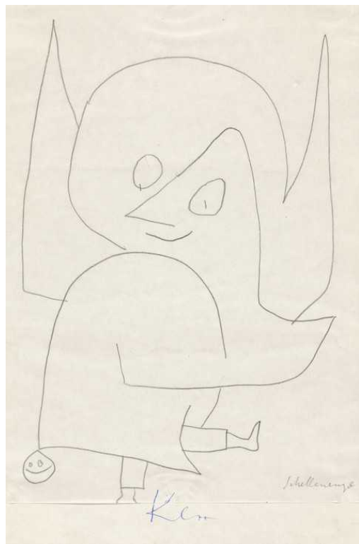
Пауль Клее. Ангел (© Zentrum Paul Klee)

представлены почти 150 произведений живописи и графики выдающегося швейцарского художника, станет последним крупным культурным проектом, организованным в уходящем году в рамках официальных празднований.