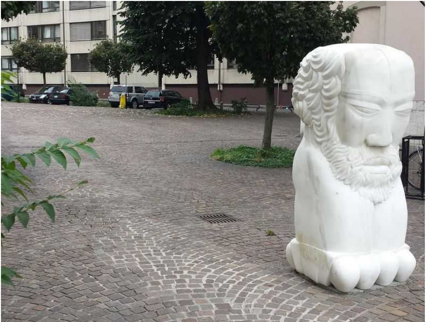
Урсу Дезала

Совсем недавно благодаря интернету у Цереры обнаружился кавалер - на страничке в фейсбуке была размещена вот такая фотография.