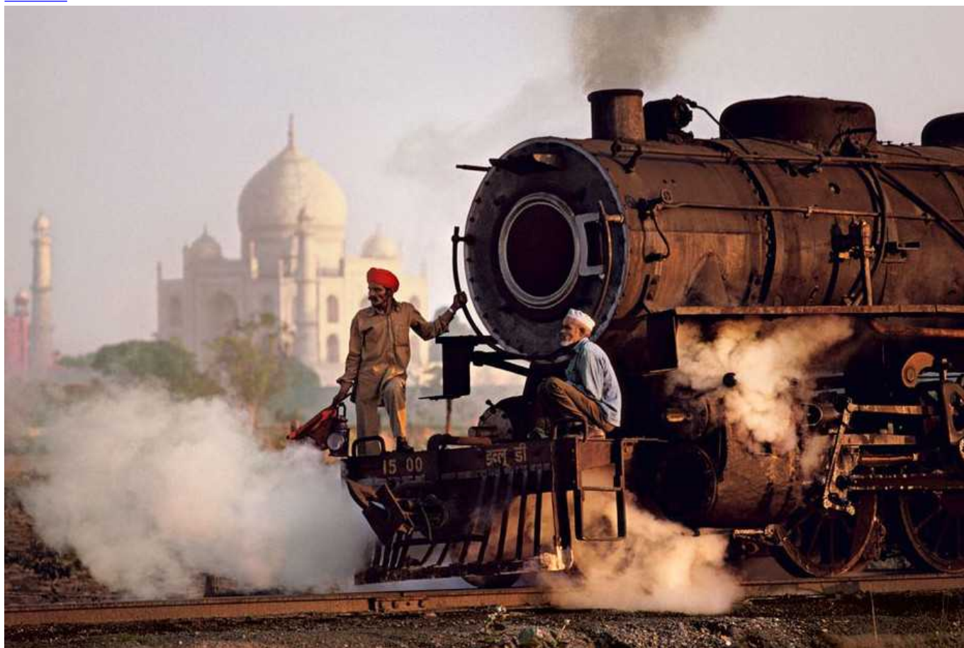
Тадж-Махал. 1983 год

Выставка продлится до 18 октября. Дополнительную информацию вы найдете на сайте .