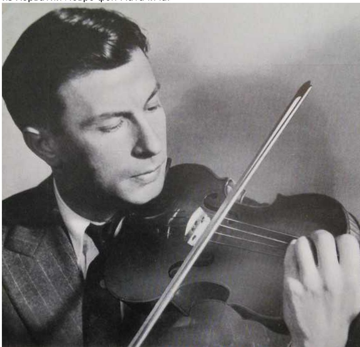
Натан Мильштейн в 1951 году

Интересно, что первый сохранившийся для истории фестивальныи концерт, запись которого, сделанная в 1953 году, хранится в архивах Радио Романдской Швейцарии, тоже «наш»: Кельнский симфонический Гюрцених-оркестр под управлением французского дирижера Андрэ Клутенса играл в тот вечер Скрипичный концерт П.И. Чайковского (солист – родившийся в Одессе Натан Мильштейн, до этого давший в Монре сольный концерт в 1951 году) и Сюиту из балета «Жар-птица» Игоря Стравинского. Тринадцать лет спустя разрешил записать свое выступление в Монре великий Святослав Рихтер, чье столетие отмечается в этом году, – фирма Claves Record выпустила диск с исполненным им Фортепианным концертом Грига ор. 16 в сопровождении Пражского Филармонического оркестра под управлением дирижера из Хорватии Ловро фон Матачича.