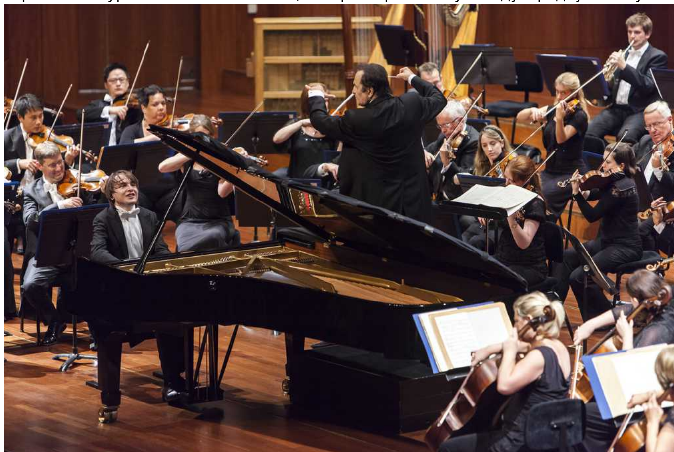
Даниил Трифонов в 2011 году