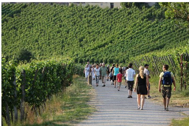
Виноградники, воздух, беседа с попутчиками... (24stops.info)

Маршрут 24 stops будет представлен в городке Риен (кантон Базель-Штадт) 27 сентября, после чего состоится праздник, который продлится весь день и на котором можно будет поучаствовать в викторине для эрудитов, оценить выступление флекстанцоров, просто от души отдохнуть. Параллельно празднику со стендов будут продаваться продукты местных производителей, так что гулять на пустой желудок никому не придется. Новый маршрут длиной шесть километров пролегает между немецким городом Вайль-ам-Райн (земля Баден-Вюртемберг) и швейцарским Риен, соединяя две страны, две коммуны и два культурных заведения – фонд Бейелер в Швейцарии и музей Vitra в Германии, которые вместе с упомянутыми городами участвовали в разработке и обустройстве пешего пути. Следуя новым маршрутом в окружении мирных пейзажей, виноградников, фруктовых садов и журчащих источников, можно открыть для себя местные культурные особенности, познакомиться со здешней флорой и фауной и узнать много новых историй. Действительно, здесь все дышит стариной: первое упоминание о Риене восходит к 1157 году, а Вайль-ам-Райн, расположенный у границ Германии, Франции и Швейцарии, впервые упоминается 27 февраля 786 года под названием «Willa» в одном из документов, хранящихся в Санкт-Галленском монастыре.