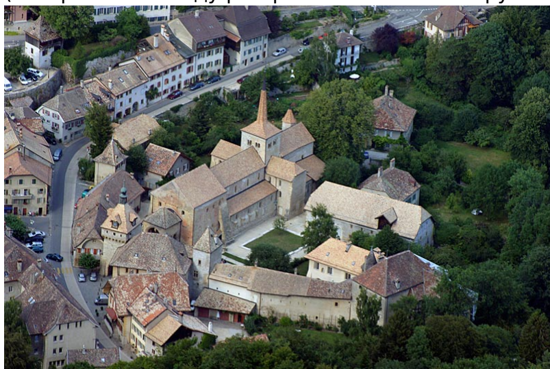
Аббатство в Роменмотье

В 573 году епископом Аванша избран Мариус – он возглавлял Церковь Гельветов вплоть до своей смерти 31 декабря 593 года. Это был типичный представитель тогдашнего духовенства: выходец из семьи богатых землевладельцев из бургундского города Отен (территория современной Франции), он сам владел землями во многих городах Галлии. Поддерживал тесные связи с аристократией и высшим духовенством того времени. По-видимому, именно Мариус перенес около 585 года епископскую резиденцию из Аванша на юг – к Леману, в солнечную Лозанну. Возможно, на его решение повлияла угроза со стороны вторжения алеманнов (которые в 610 году разграбили селения вокруг Аванша).