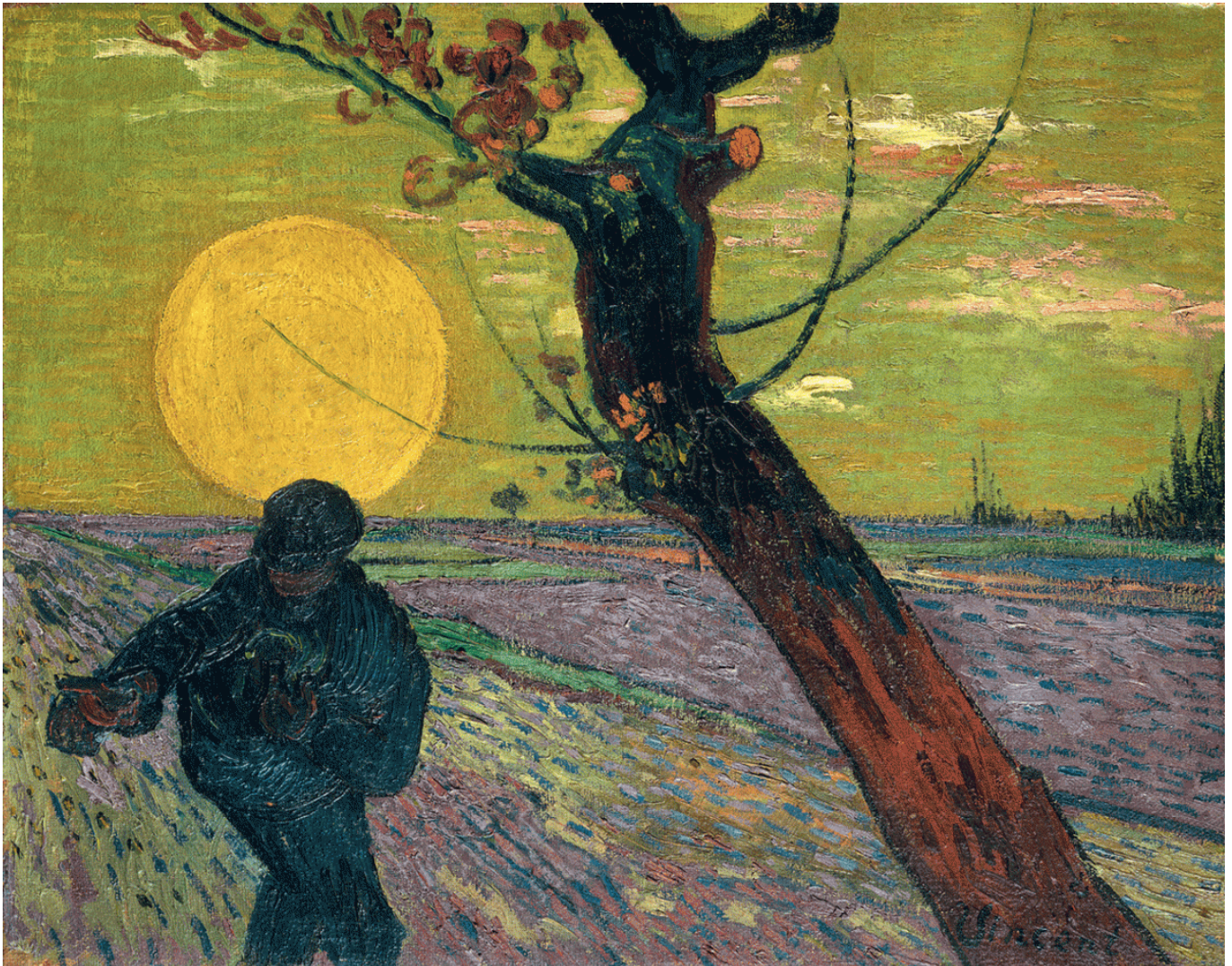
Винсент Ван Гог. Сеятель на закате солнца, 1888. Масло, холст, 73 x 92 см (Fondation Collection E.G. Bührle, Zurich)

Такая возможность предоставлена всем любителям живописи в ближайшие несколько месяцев, достаточно добраться до Лозанны, проехать (или пройти) по ее извилистым улочкам и оказаться в изысканном музее, расположенном в вилле 19 века, принадлежавшей банкиру Шарлю-Жусту Буньону и переданной его наследниками городу в 1976 году. В течение последних двадцати лет особым направлением деятельности Фонда Эрмитаж стало изучение крупных частных швейцарских коллекций, так что нынешняя экспозиция, куратором которой выступил директор цюрихского Фонда Коллекции Э. Г. Бюрле Лукас Глоор, – логическое развитие проводимой работы.