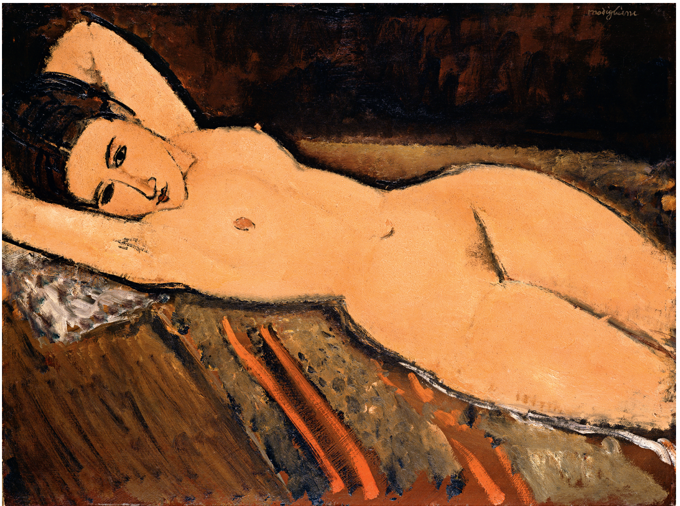
Амедео Модильяни. Лежащая обнаженная, 1916. 65,5 x 87 см

Auteur: Надежда Сикорская, Лозанна , 10.04.2017.