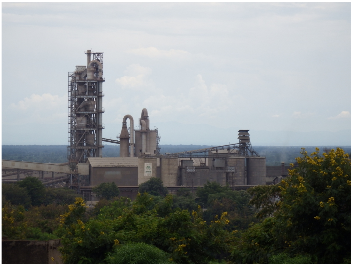
Цементный завод Hima Cement в Уганде – дочернее предприятие концерна LafargeHolcim

Наши постоянные читатели уже знают, что концерн LafargeHolcim был образован в 2015 году в результате слияния двух компаний – французской Lafarge и швейцарской Holcim. В 90 филиалах концерна по всему миру, включая и постсоветское пространство, работают 115 000 сотрудников. Годовой оборот крупнейшего в мире производителя строительных материалов составляет около 30 миллиардов евро.