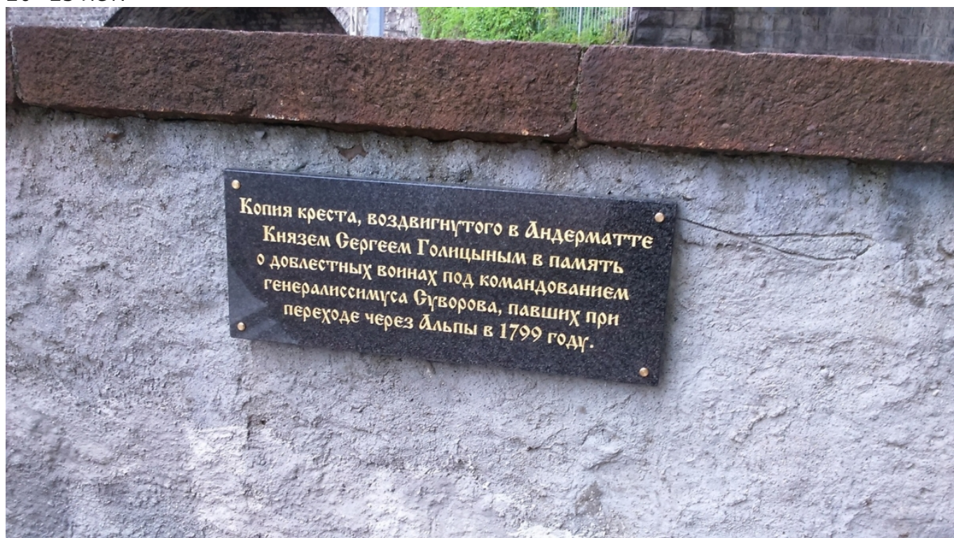
Памятная надпись на Суворовском кресте.

Заметим, что местные власти часто связывают все описываемые события по благоустройству не с осенним мини-юбилеем 2018 года, а с грядущим летом следующего, 2019-го, знаковым событием для города Веве и, пожалуй, всей Романдской Швейцарии – Праздником виноделов, который проводится здесь каждые 20–25 лет.