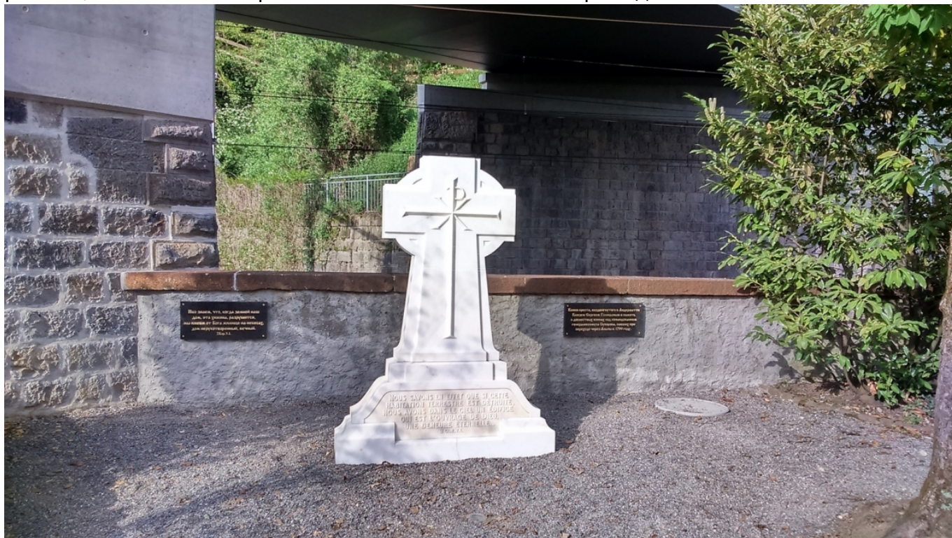
Суворовский крест во дворе храма.