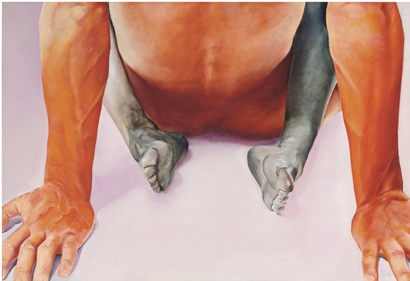
Joan Semmel, Untitled, 1972, oil on canvas, 118.7 x 174.6 cm, Grażyna Kulczyk Collection.

Гражина Кульчик – бывшая жена скончавшегося в 2015 году польского миллиардера Яна Кульчика, среди прочего не давшего пропасть, в 2007 году, одному из начинаний Михаила Горбачева, Международному Зеленому Кресту со штаб-квартирой в Женеве. Называемая некоторыми самой богатой женщиной Польши, Гражина – известный инвестор, коллекционер и филантроп. Выпускница Университета имени Адама Мицкевича, она больше всего интересуется современным искусством и авангардной хореографией, но поддерживает также развитие новых технологий и женское предпринимательство, отстаивая присутствие женщин в математике и других науках наравне с мужчинами. Включенная в список 200 крупнейших коллекционеров мира журналом Art News, Госпожа Кульчик давно и активно поддерживает лондонскую Tate Modern, где является членом закупочного комитета русского и восточно-европейского искусства, нью-йоркский MOMA и Музей современного искусства Варшавы. И вот теперь создала свой собственный музей в неожиданном месте, которое благодаря этому смелому проекту имеет шанс прославиться на весь мир, как Давос благодаря ВЭФ.