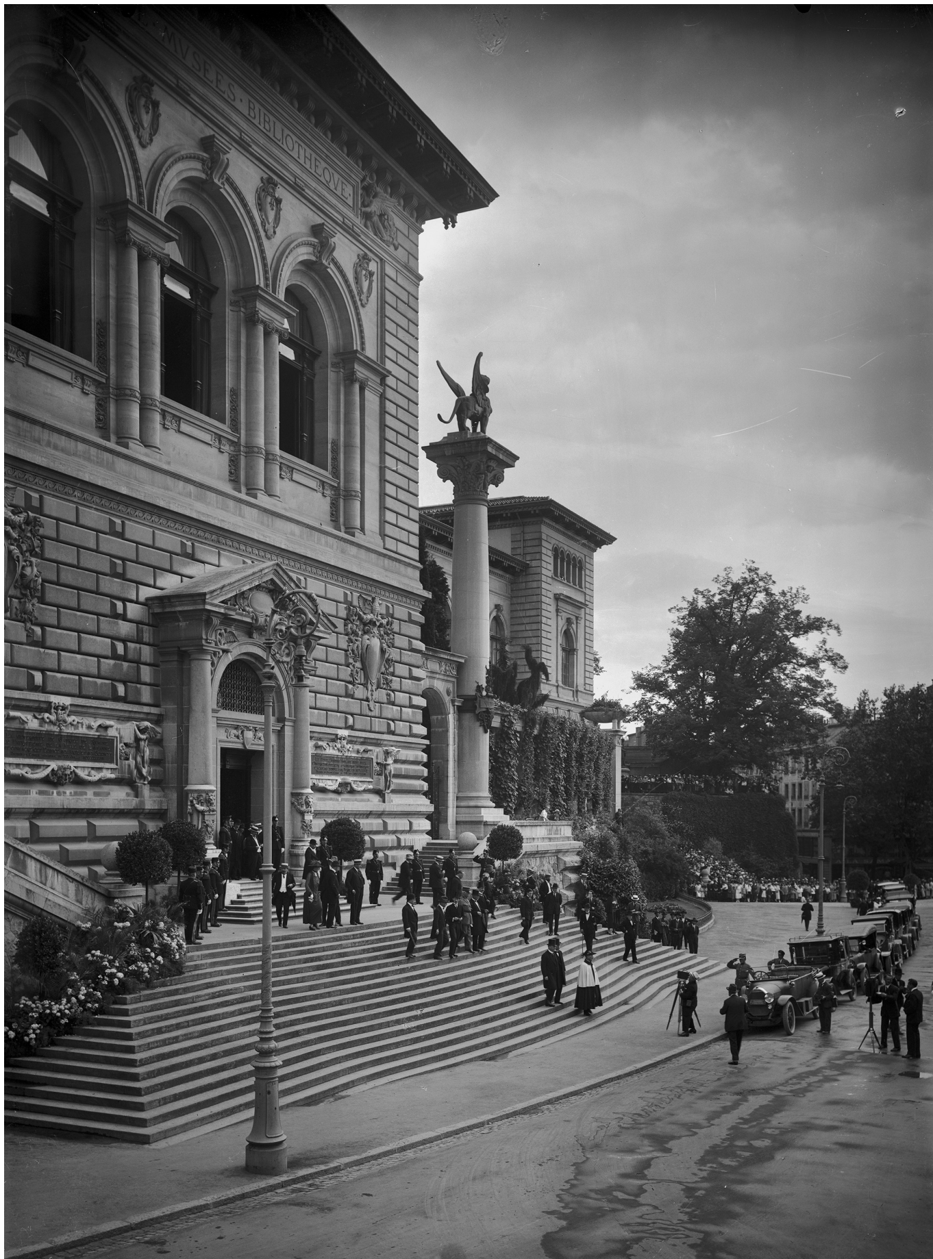
Так выглядел Дворец Рюминых 24 июля 1923 года

В целях же недопущения этнических конфликтов между турками и проживавших в Малой Азии греками после поражения Греции во Второй греко-турецкой войне