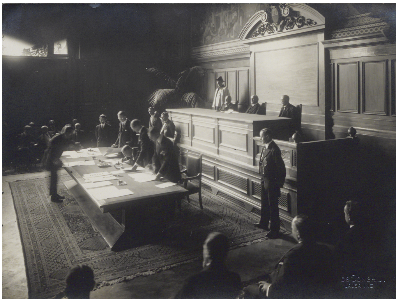
Подписание Лозаннского мирного договора 24 июля 1923 г.