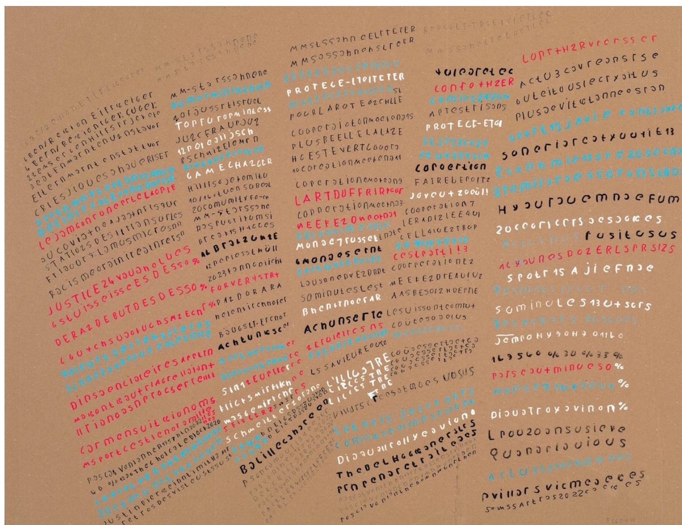
Работа Паскаля Вонлантена "6BenREgion"

Auteur: Заррина Салимова, Женева , 01.02.2024.