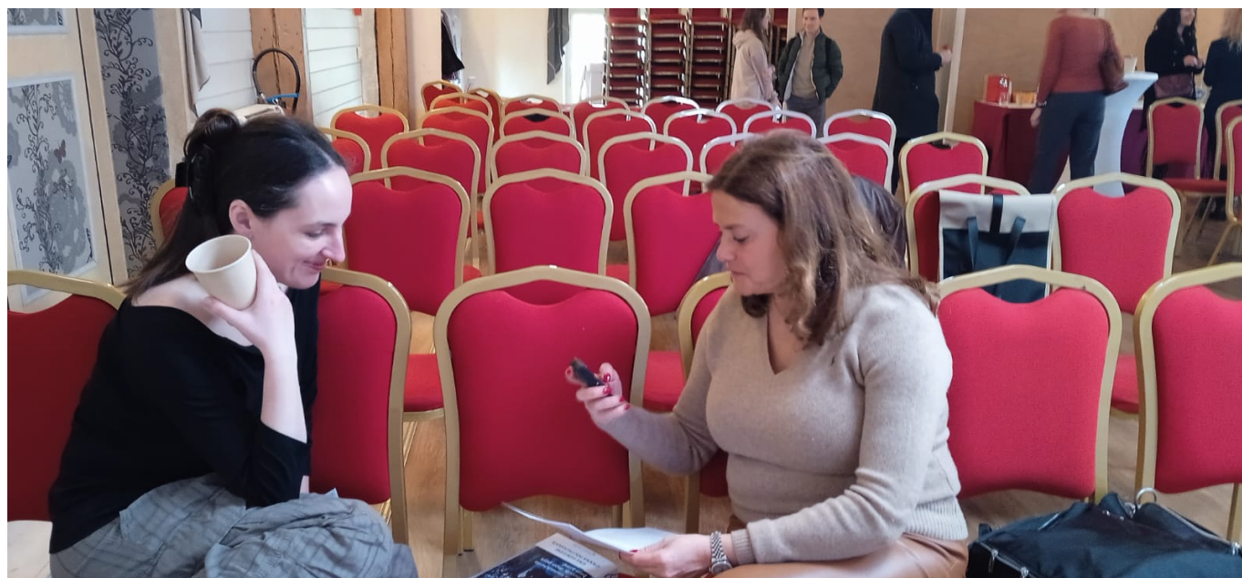
Во время интервью

Я не считаю, что это низший слой общества. Я вообще не считаю, что иерархичность в обществе полезна, и стараюсь максимально от нее отойти и в книге, и в жизни. К сожалению, наше общество крайне иерархично – об этом можно судить и по тому, каких героев мы чаще всего слышим в медиа. Мне всегда хотелось разговаривать именно с теми, с кем никто разговаривать не хочет, поскольку именно они могут рассказать, как все устроено, именно исключенные из системы знают о ней правду.