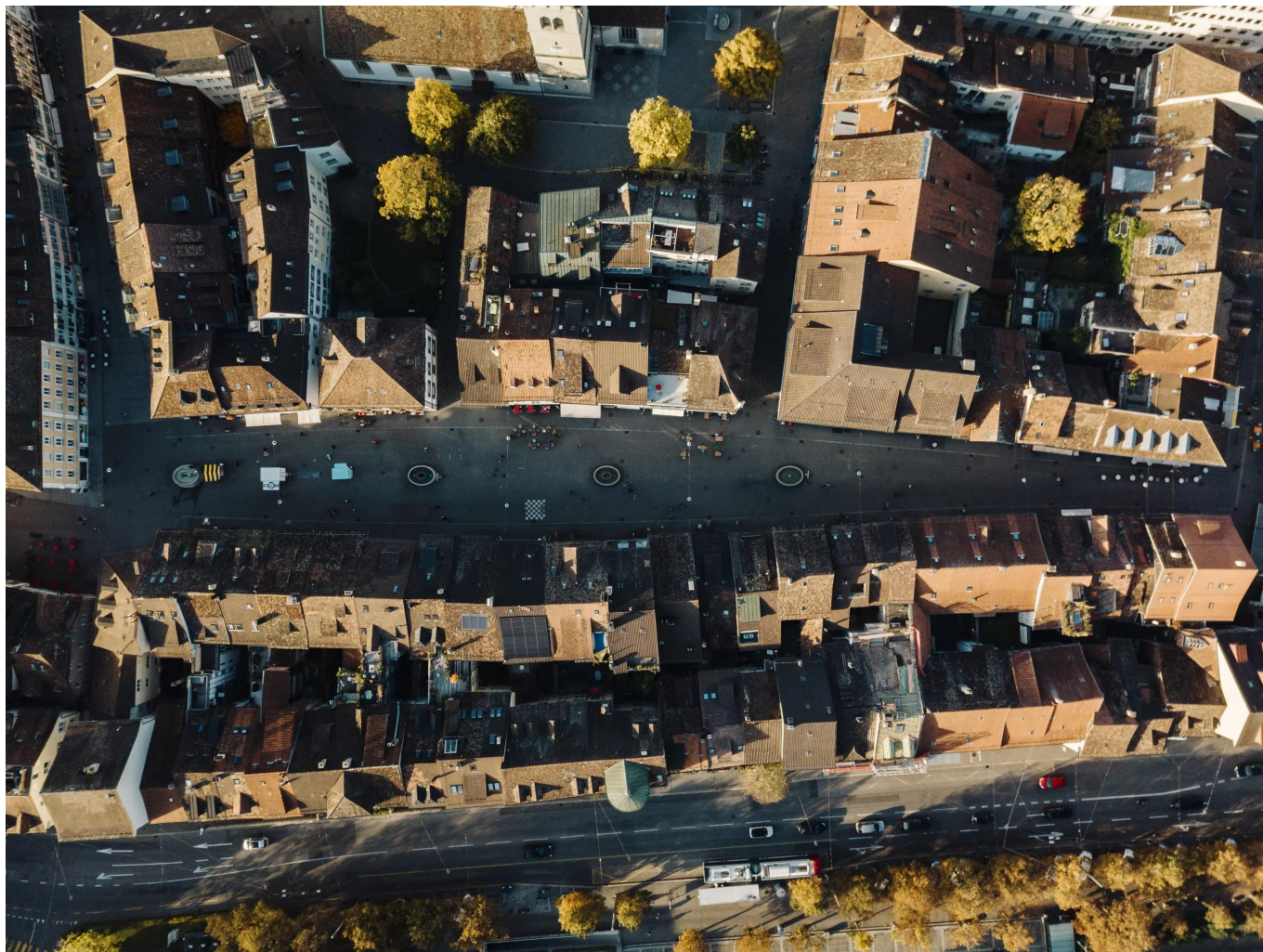
Старый город Винтертура

В плотно застроенном и оживленном Старом городе Винтертура, объекте национального значения, люди и исторические здания тесно взаимосвязаны. Многовековые несущие конструкции, исторические и современные жилые и коммерческие помещения, история домов и их обитателей... Работа по сохранению наследия в Старом городе объединяет широкий спектр дисциплин, обычно выходящих за рамки восстановления отдельного здания: от теоретического анализа и практического исследования до технического воплощения. Без сотрудничества многочисленных специалистов сохранение памятников было бы невозможным. Во время экскурсии по историческим переулкам вы узнаете больше о захватывающих связях между застроенным пространством и его интенсивным использованием в прошлом, настоящем и, вероятно, будущем.