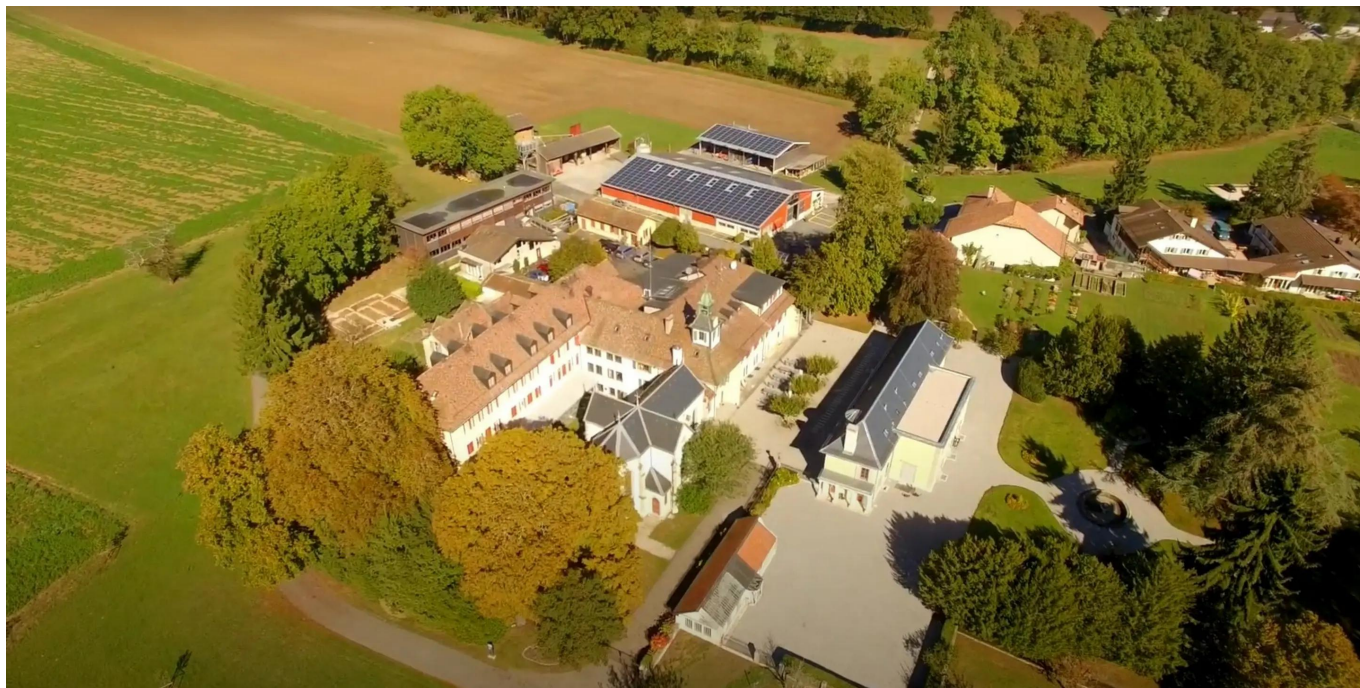
Экогия близ Версуа, кантон Женева

Экогия, расположенная в сельской местности Версуа, близ Женевы, – место с богатой историей. Табличка на основании акведука напоминает о том, что его источник использовался еще римлянами. Расположение на перекрестке двух древних путей сообщения делает это место обязательным для посещения именно в эти тематические дни. Кажется, вечность отделяет Экогию и учреждения, которые сегодня сделали ее своим домом – это Международный Комитет Красного Креста (МККК), Женевская обсерватория, а также Королла (La Corolle), ассоциация, заботящаяся о людях с физическими недостатками. Обратите внимание также на часовню Богородицы Семи скорбей (Notre-Dame des Sept-Douleurs), построенную в 1862 году баронессой Жиро де л'Эн для захоронения останков членов ее семьи и позже переданную Римско-католической церкви Женевы. Внесенная в список исторических памятников в 1988 году, она была отреставрирована в 2019 году. Вокальный ансамбль Évoqué представит здесь *Ad Astra*, композицию на тему космоса и звезд (8 сентября в 14 и 17 часов).