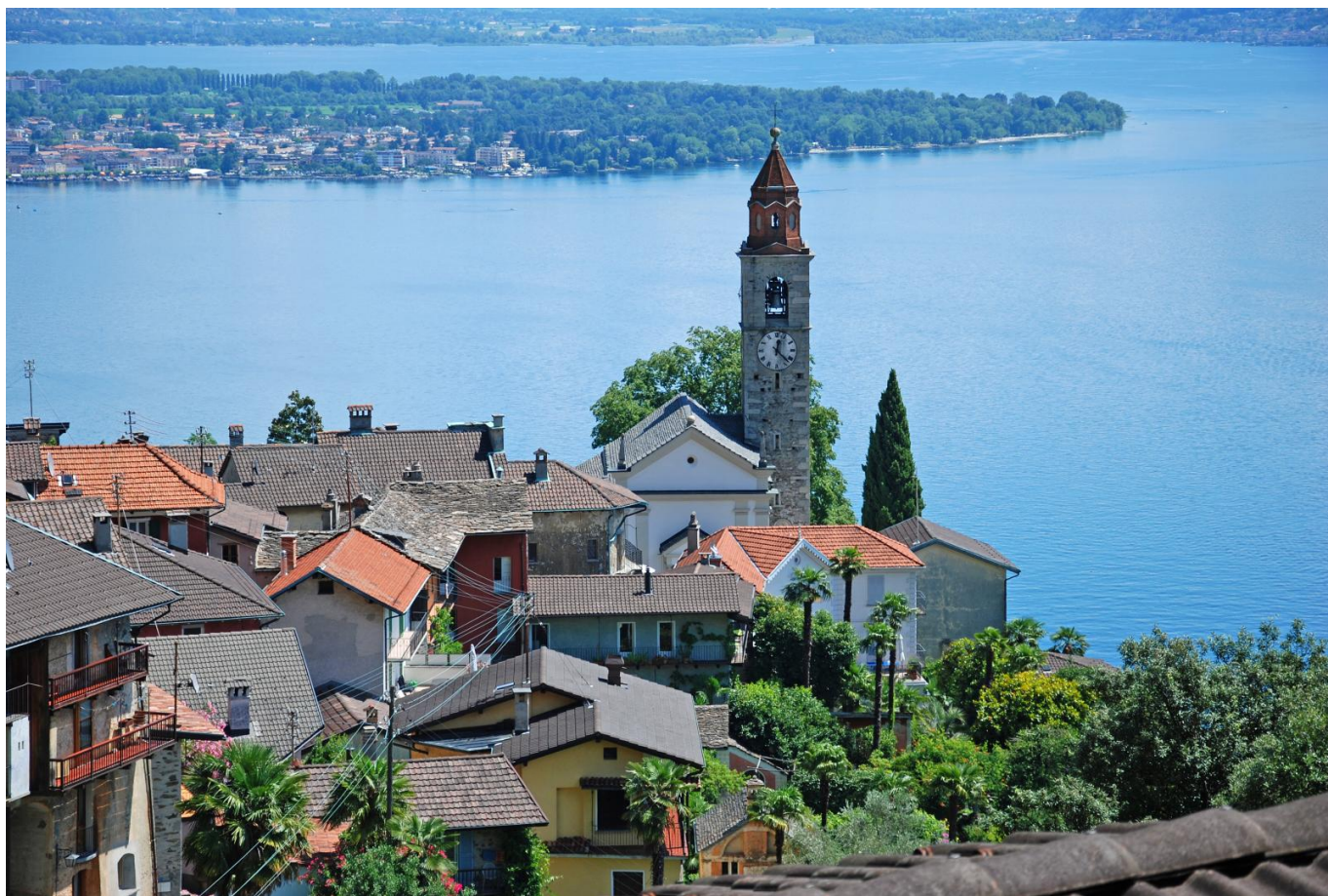
Деревушка Ронко-сопра-Аскона - ну разве не красота?

Auteur: Надежда Сикорская, Берн , 30.08.2024.