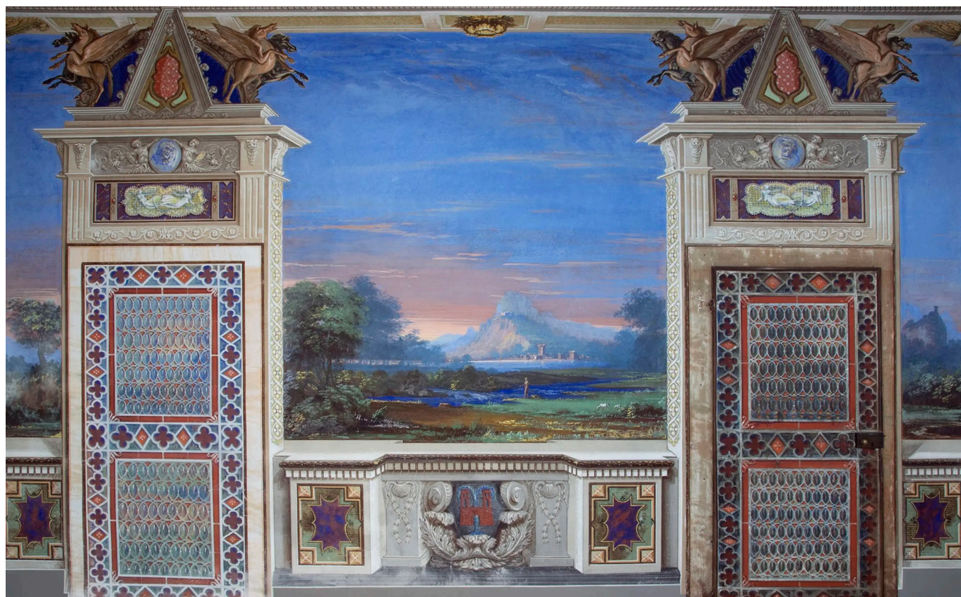
Ронко-сопра-Анкана