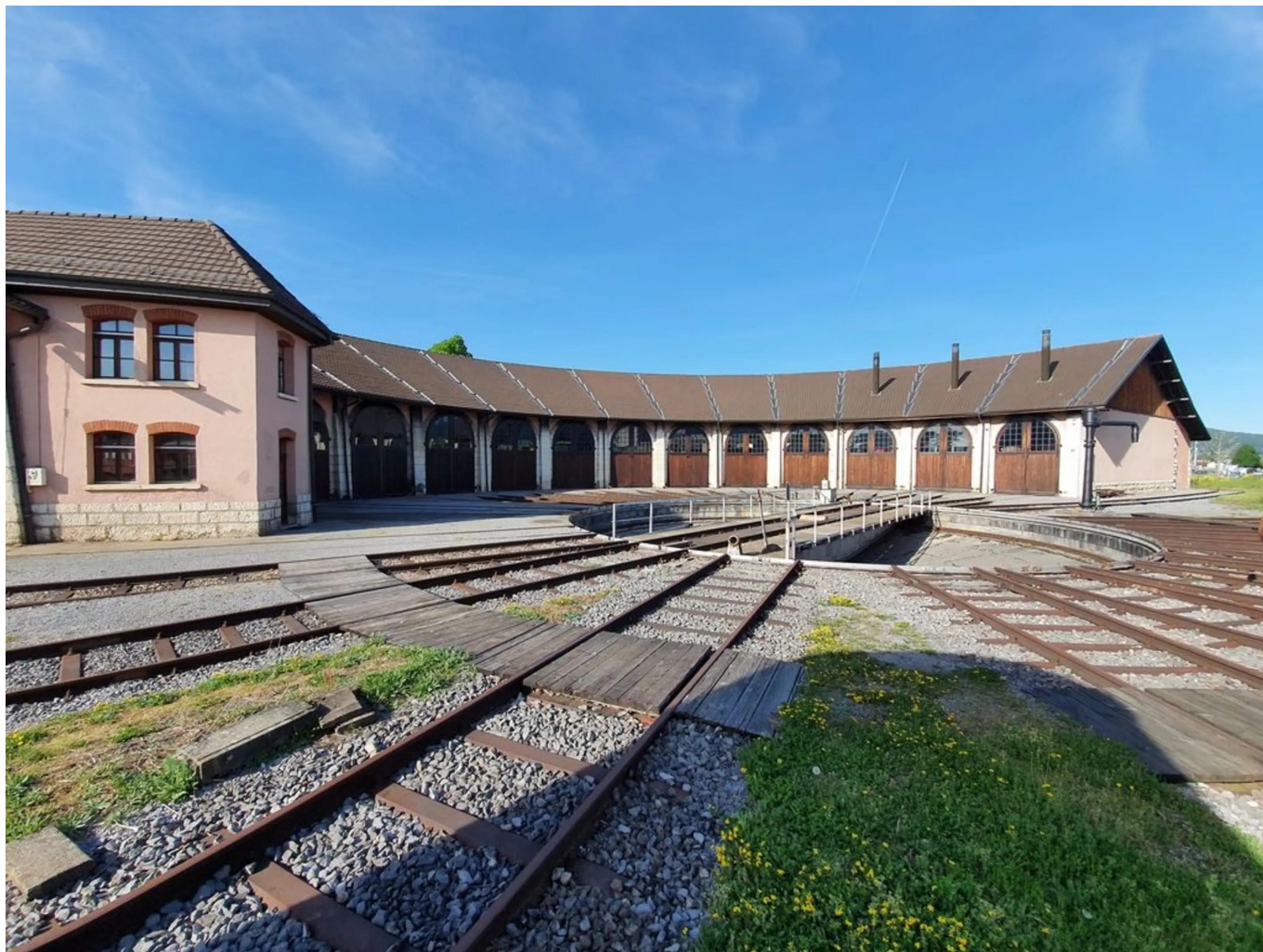
Ротонда Делемона

Откроет перед вами двери и ротонда Делемона в кантоне Юра, построенная в 1889 году. Здесь вы сможете со всех сторон обследовать вагон В 3505, который в настоящее время находится на реставрации, а также ознакомиться с великолепной исторической коллекцией Швейцарских железных дорог – даже взрослым захочется поиграть в паровозики!