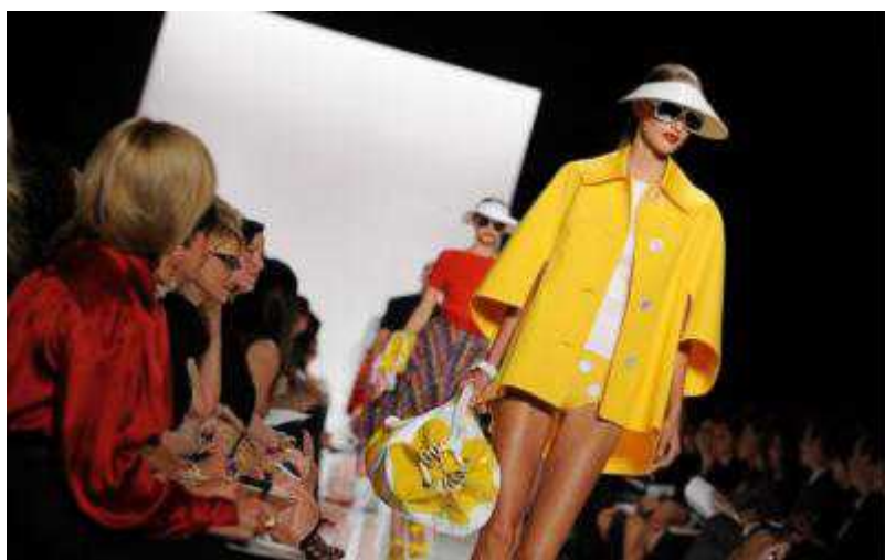
Весенне-летняя коллекция Michael Kors

Auteur: Надя Мишустина, Женева , 28.01.2009.