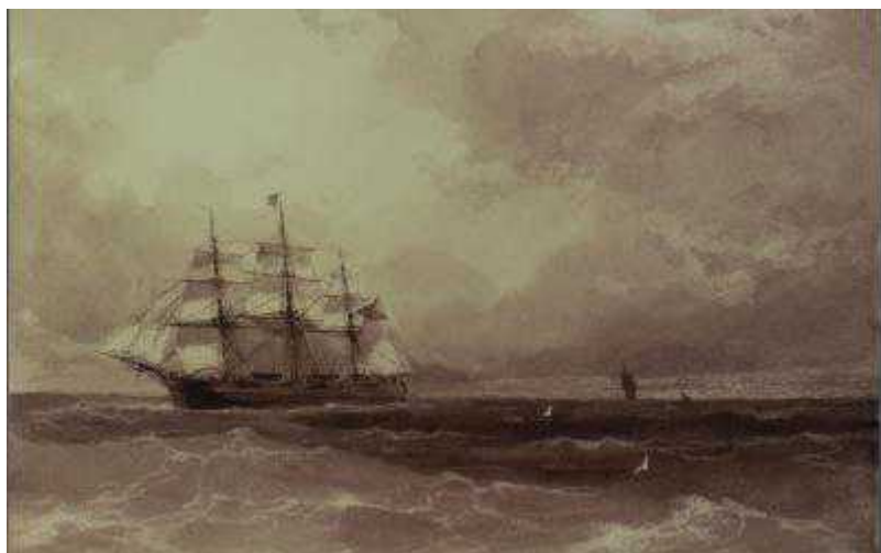
И. К. Айвазовский, "Корабль в открытом море", 1892

Auteur: Ольга Юркина, Женева , 13.03.2009.