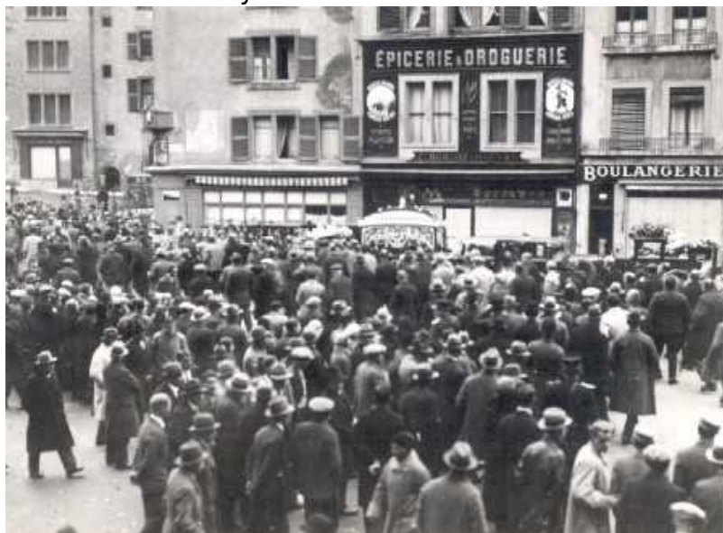
Начало митинга Национального Союза (assmp.org)

деревьями, а в 1662 году, после демонтажа городских фортификаций, она приняла уже современные, знакомые нам очертания. В 1848 году Пленпале приобрел статус Женевской коммуны.