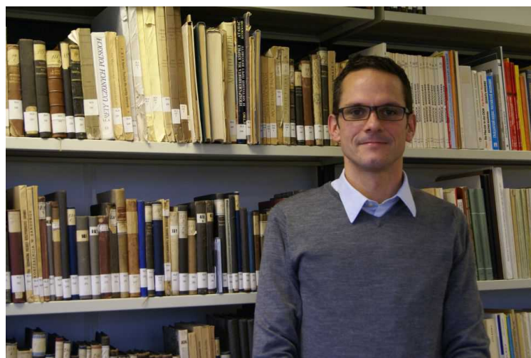
С книгами по польской литературе

На самом деле, все еще сложнее. У нашей кафедры славистики во Фрибурге общая программа с университетом Берна. Мой коллега-славист в Бернском университете занимается средневековой русской литературой и лингвистикой, а я – литературой XIX-XX веков и литературоведением. Разделены компетенции и по другим славянским языкам: у нас изучают польский, в Берне – сербский, боснийский и хорватский. Во всех областях мы взаимно дополняем друг друга, а наши студенты путешествуют между Берном и Фрибургом. Признаюсь, составить совместное расписание между двумя городами – отдельная наука. Не всегда плавно проходит и пересечение языкового барьера, знаменитого Рёштиграбен. Поэтому на семинарах и лекциях мы пытаемся учитывать индивидуальные языковые проблемы студентов, переходим с немецкого на французский, иногда и к помощи английского прибегаем.